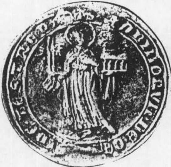
Zegel van de stad Oostende, 1335.