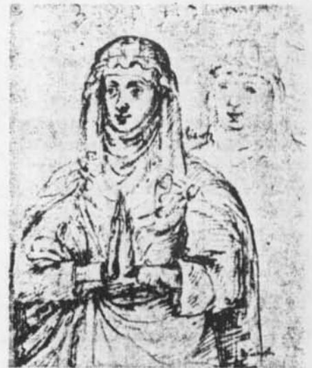
- Margaretha van Constantinopel naar schetsen van Antoon de Succa, hs. II, 1862, Kon. Bibl., Brussel