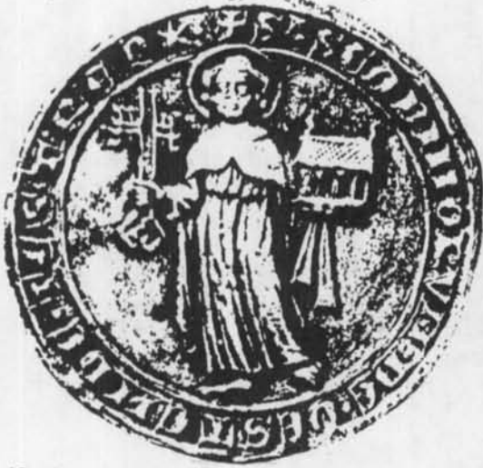
Oorkondenschat, J 552, nr. 30, akte van 2 juli 1309