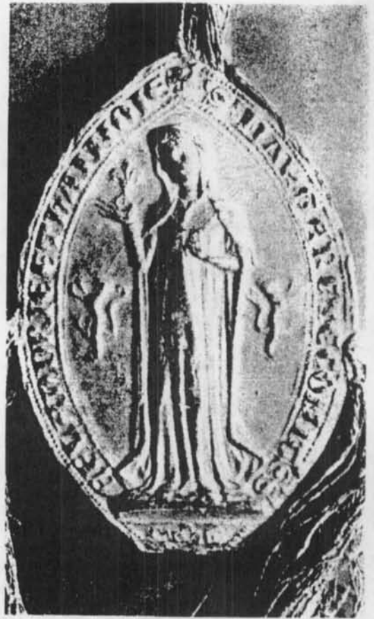
- Zegel van Margaretha van Constantinopel, Algemeen Rijksarchief, Brussel