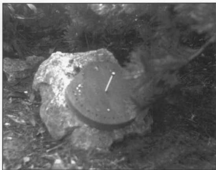
De Noordwijzer Roerdompstraat 13