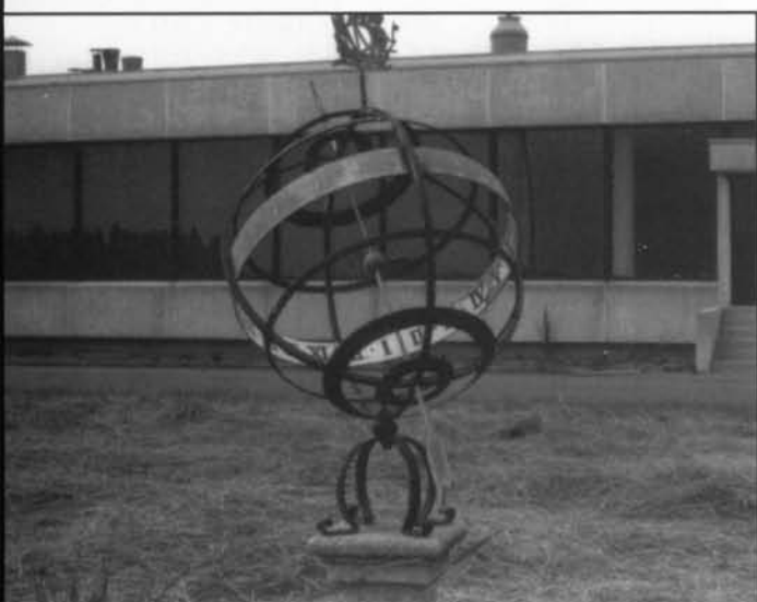
De Equatoriale zonnwijzer voor het hoofdgebouw van DAIKIN