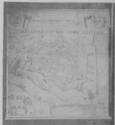
RESTAURÉ CE 20 X BRF 1895