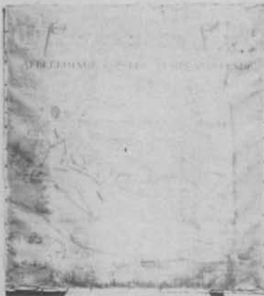
PHOTOGRAPHIE PRISE AVANT LA RESTAURATION