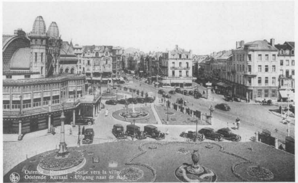
Ostende - Kursaal - Sortie vers la ville Oostende - Kursaal - Uitgang naar de stad