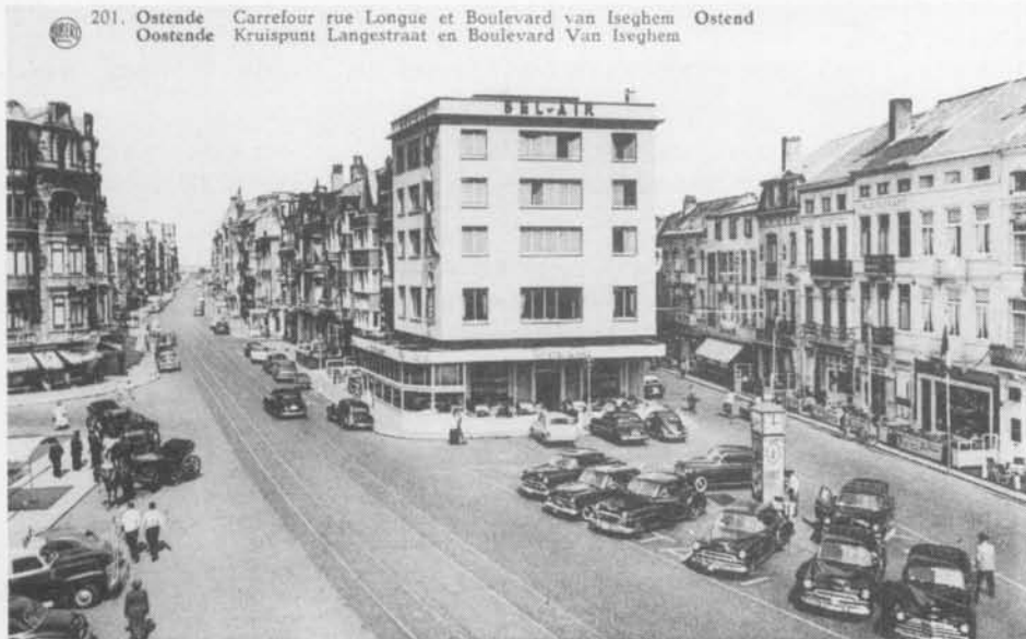
201. Ostende Carrefour rue Longue et Boulevard van Iseghem Ostend Oostende Kruispunt Langestraat en Boulevard Van Iseghem