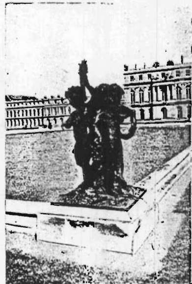
L'AILE DU NORD, VUE DU PARTERRE D'EAU

En 1893, à l'Exposition Universelle de Chicago, plusieurs grands groupes en fonte de fer, copies de sculptures du château de Versailles, eurent un succès certain auprès du public américain. A cette manifestation furent remarquées deux œuvres d'Auguste Moreau, Neptune et Vénus , et un Faune buvant , grandeur nature, elles aussi fondues 66 au Val d'Osne. Le rapport de cette exposition précise que ces fonderies « n'emploient pas moins, chaque année, de 7 millions de kilogrammes de fonte de fer ».