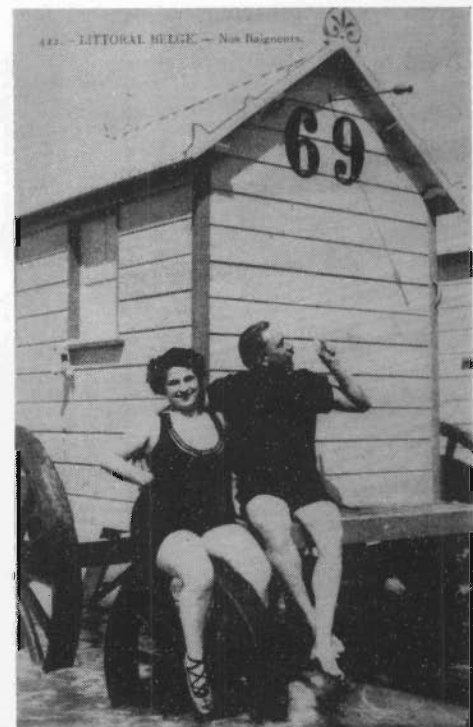
Prentkaart met veel allusie (1910)