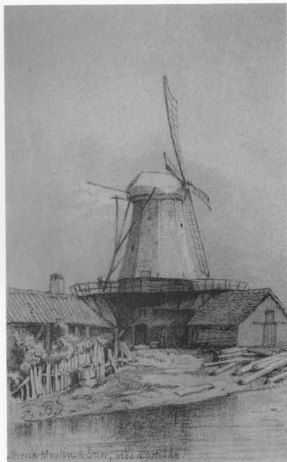
▲ De zaagmolens te Slykens in 1821