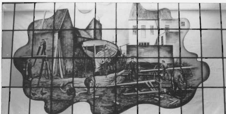
Het brandglasraam zoals het gerealiseerd werd en nu geplaatst is (Met welwillende toelating van de heer en mevrouw R. Sanders)