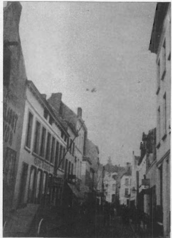
Een foto van DEMUENYNCK: straatscène in de Hertstraat (circa 1890) (verz. O.V.)