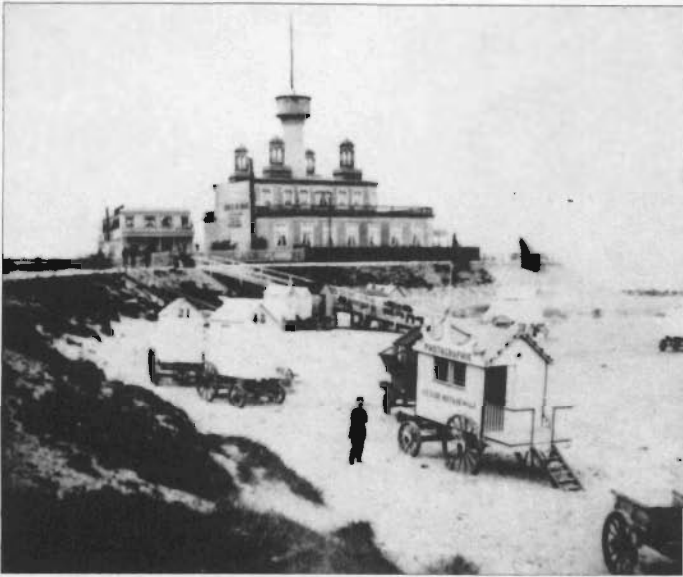
Een fotokabine van Cesar mitkiewicz op het Kleine Strand (circa 1850).