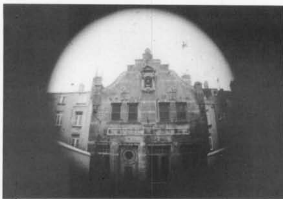
De gevel tegen een achtergrond gevormd door de achterkant van de huizen in de Peter Benoîtstraat.