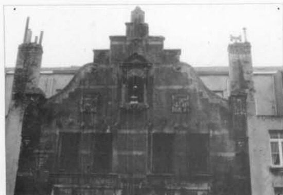
Een zicht op het bovengedeelte van de gevel