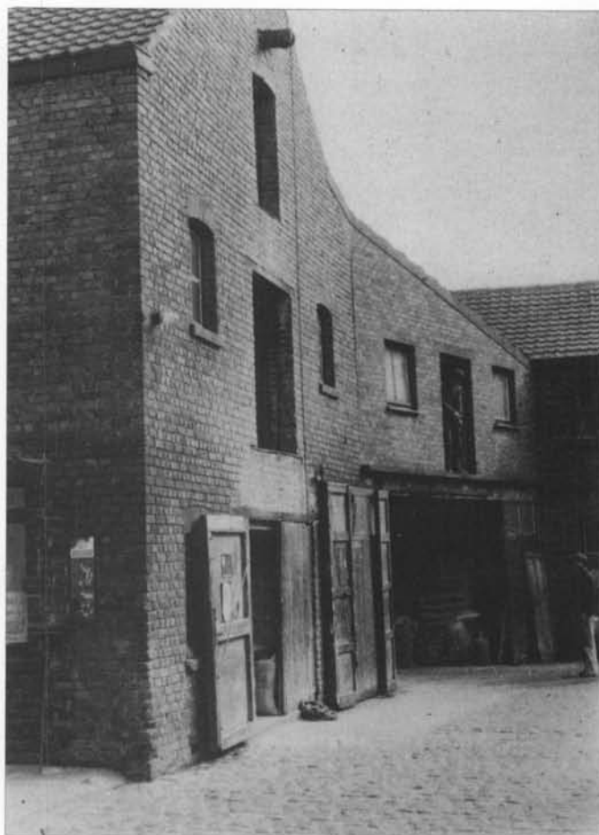
Torhoutse steenweg 496 bij de gebroeders ROMMEL waar de laatste Oostendse molenstenen knarsen...