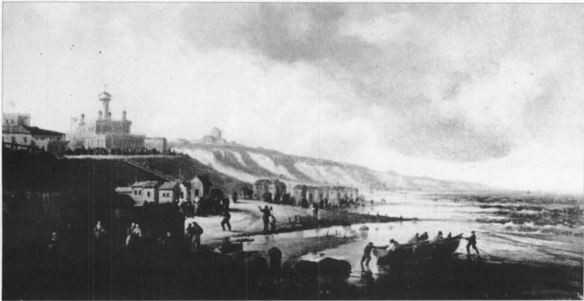
THOMSON: GEZICHT OP DE BADEN EN DE CERCLE DU PHARE