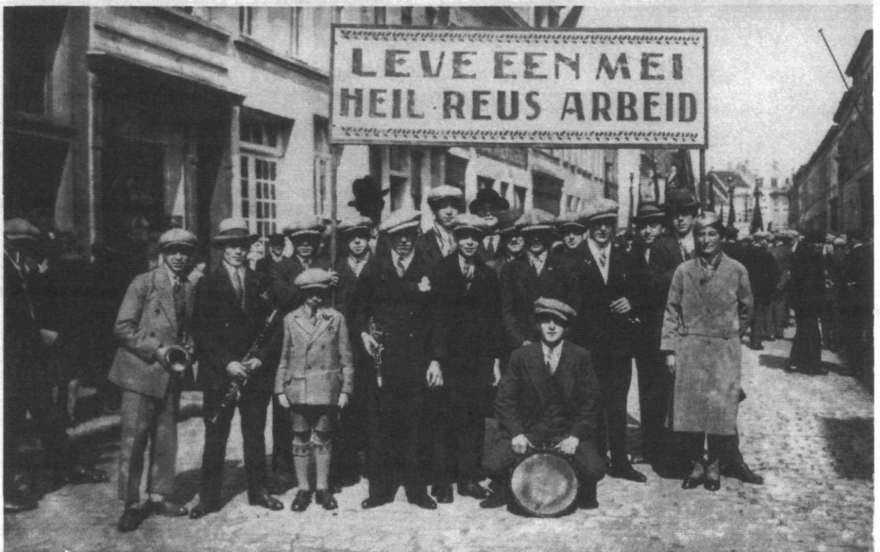
Uit het Rijke Rode Leven : 1 mei-betoging Oostende, 1928