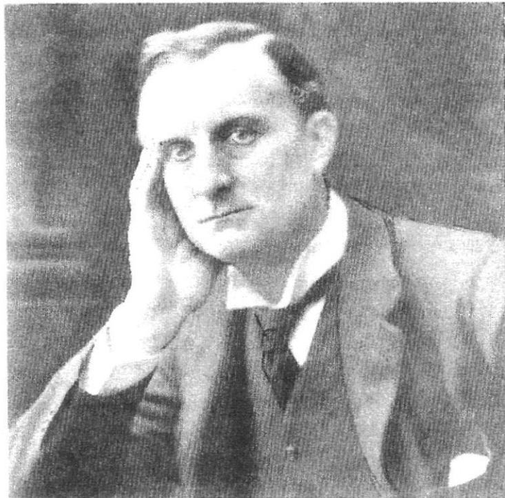
Sir Edward Grey, Brits Minister van Buitenlandse Zaken.