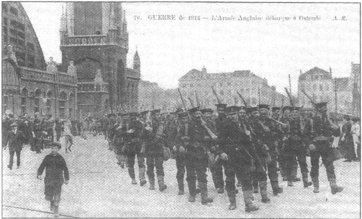
Ontschepping van Britse mariniers in Oostende, augustus 1914.