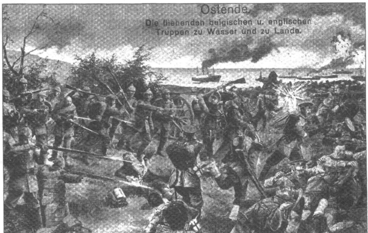
Postkaart "Ostende. Die fliehende belgische und englische Truppen".