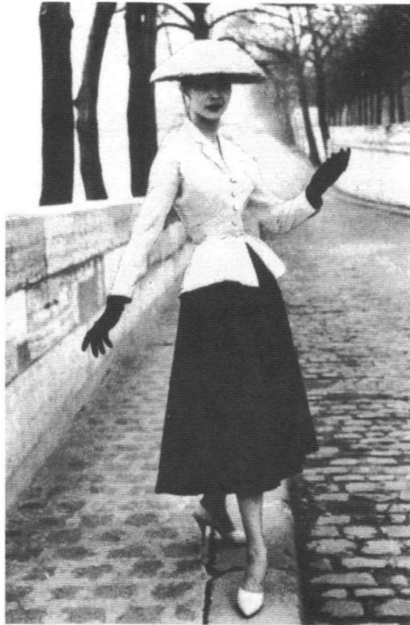
Invloed van de “zazous” op de “haute couture”: de “Dior look” (1947)