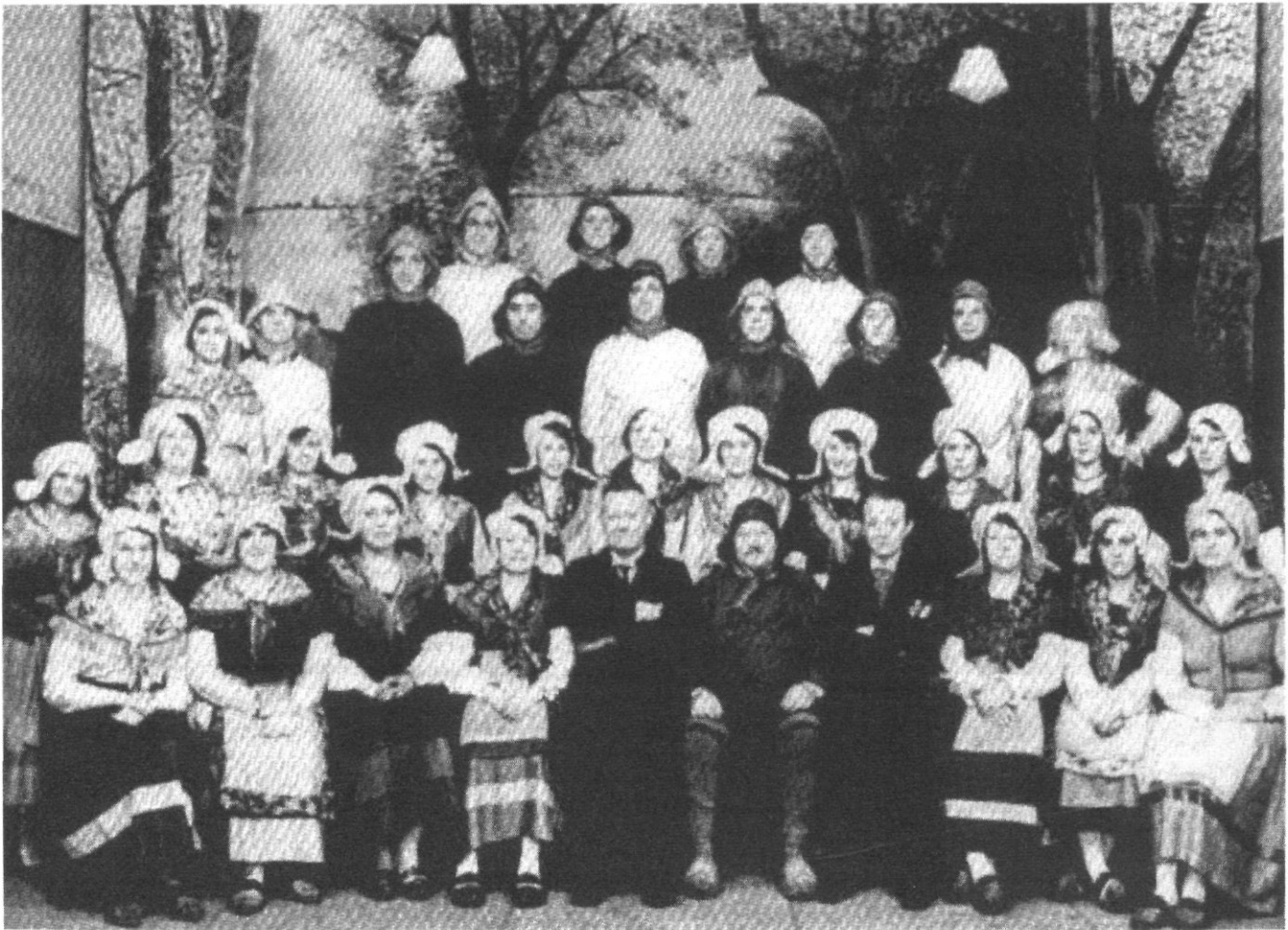
Zangvereniging “Het Looze Visschertje” (1933)