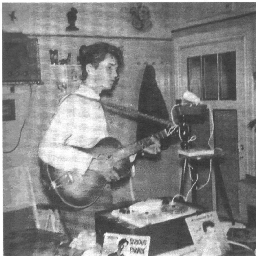
Geboorte van Oostende rock in een keukentje (1956)