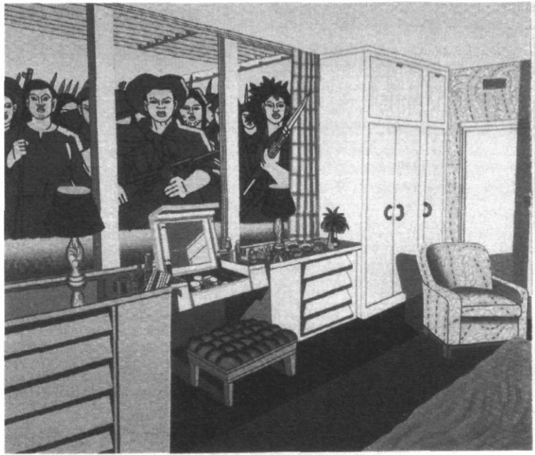
“American interiors” popart van Eco (1986)