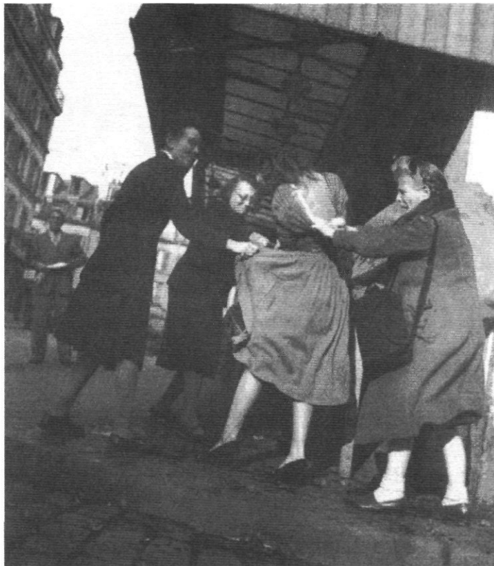
“shoking”? – Parijs rue Lepic: haat tegen de “new look” van Dior !