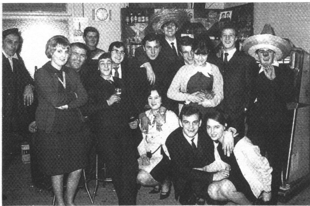
1964: vrolijke rockfans in het Visserskwartier !