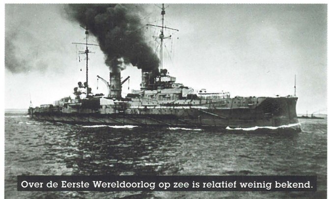
Over de Eerste Wereldoorlog op zee is relatief weinig bekend.

Het grote verschil tussen de bekende militaire begraafplaatsen van de Westhoek en sites met onderwatererfgoed is dat deze laatste in