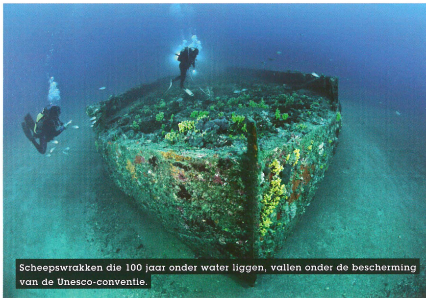
Scheepswrakken die 100 jaar onder water liggen, vallen onder de bescherming van de Unesco-conventie.

Niets in de Conventie belet echter om internationale afspraken te maken voor een versterkte of versnelde bescherming van het onderwatererfgoed van de Eerste Wereldoorlog. In zijn bijdrage over de toestand van het cultureel onderwatererfgoed van de Eerste Wereldoorlog, riep Michel L'Hour van het Franse Département des recherches archéologiques subaquatiques et sous-marines dan ook op om internationale ▶