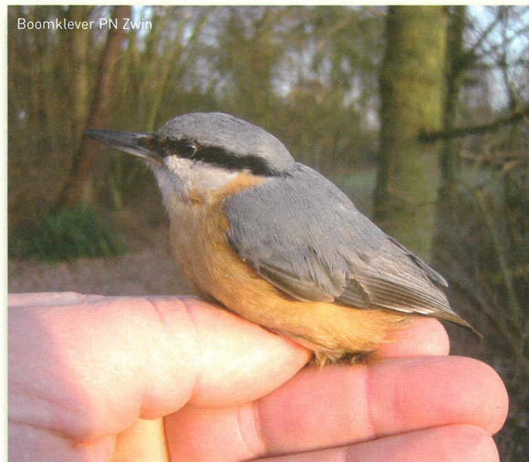
Boomklever PN Zwin

Info: Vlaams Bezoekers- en Natuureducatiecentrum De Nachtegaal T 058 42 21 51 • www.vbncdenachtegaal.be