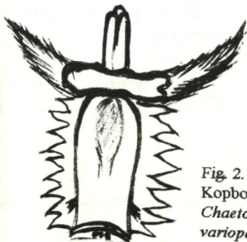
Fig. 2. Kopborststuk Chaetopterus variopedatus

1 perkamentkokerworm Chaetopterus variopedatus (het dier zelf was voor een groot deel uitgedroogd, van de middelste en achterste zone was niets terug te vinden in de koker, het kopborststuk (zie fig. 2) was nog zeer vers en vertoonde in zee water nog spierreacties.