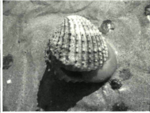
Foto 2: Acanthocardia tuberculata gevonden te Saint-Jacut-de-la-Mer