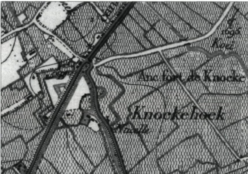
Kaart 1: Knocke Fort stafkaart 1883: op het einde van de 19de eeuw zijn de voormalige fortgrachten van het 'Fort de Knocke' op de stafkaart nog als open water ingekleurd. De hier beschreven vindplaats bevindt zich in de oostelijke (rechter) zigzagvormige gracht boven de "N" van het woordje "Nacelle".

Wegens plaatsgebrek in het vorig nummer van de Strandvlo werd dit artikel in twee delen opgesplitst. In dit deel vind je een kaart, enkele foto's en de literatuurlijst.