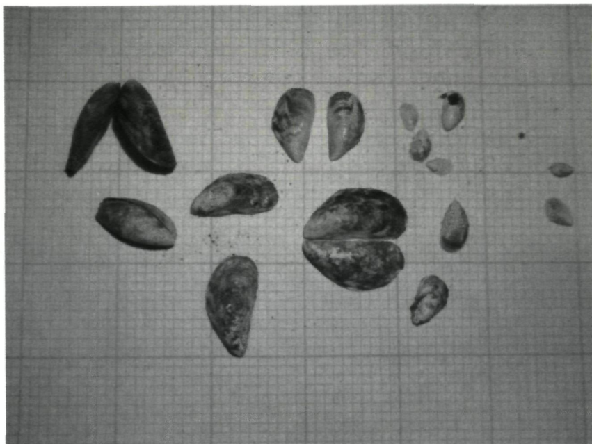
Foto 1 : overzichtje van een aantal brakwatermosseltjes, incl. enkele doubletjes, op millimeterpapier