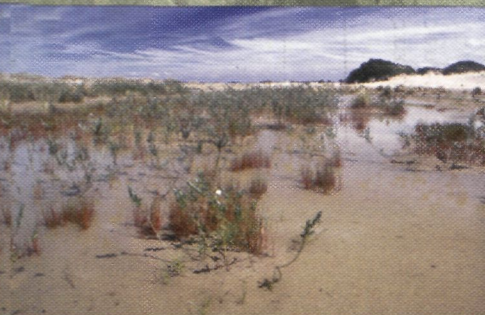
Luchtfoto van het RWZI complex

Na de afbraak en de nodige werken zal ook dit domein het statuut van Vlaams natuurreservaat krijgen en kunnen belangrijke doelsoorten zoals Kamsalamander, Parnassia, verschillende orchideeën, ... er zich opnieuw thuisvoelen.