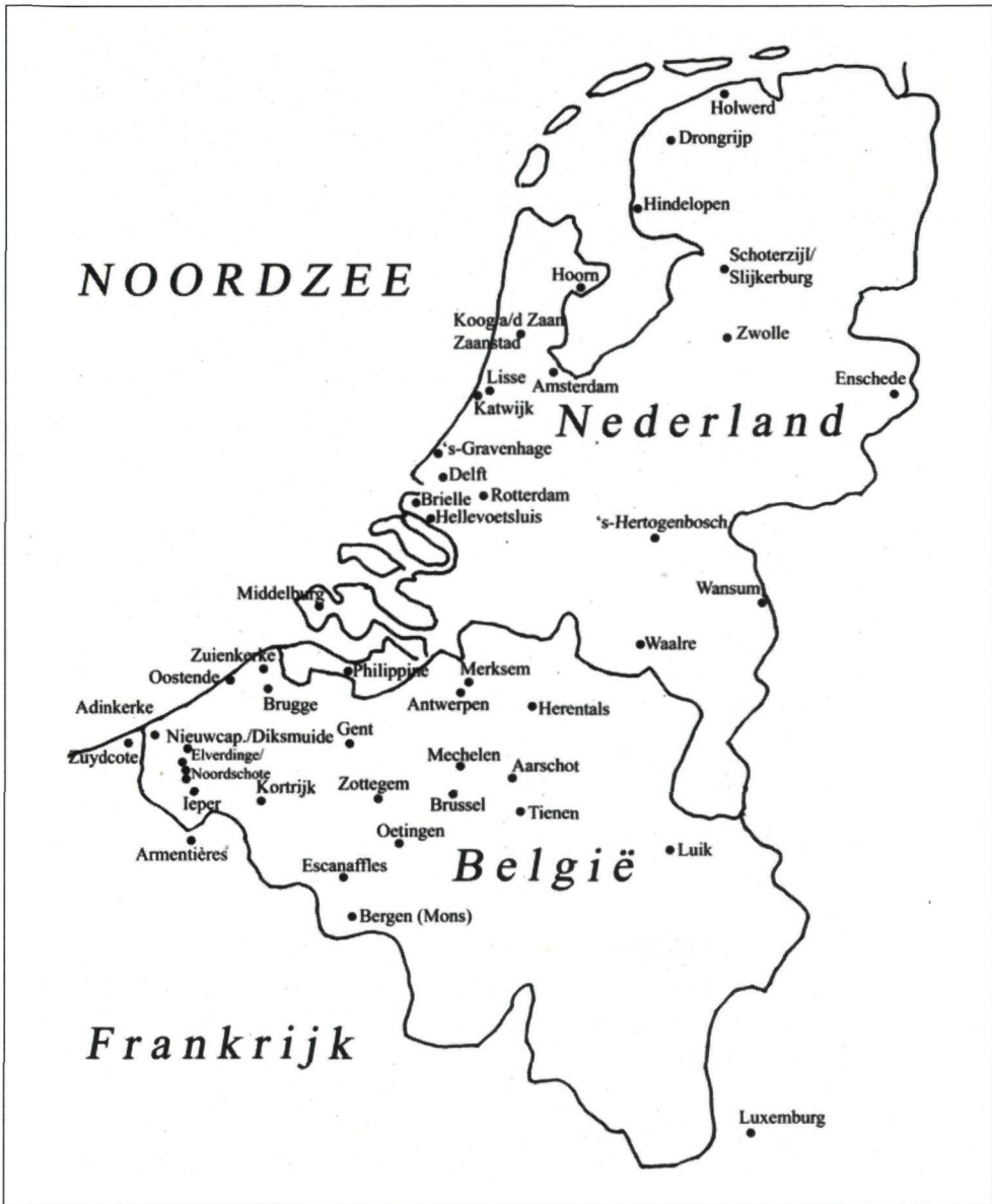
Figuur 3. Kaart van de Lage Landen met locaties van stormschade 7-8 december 1703 (tekening A. de Kraker).