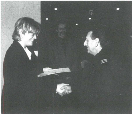
De sluiswachters in de bloemetjes gezet.

Naar jaarlijkse traditie belooft Promotie Binnenvaart Vlaanderen die sluiswachters die uitmunten in hulpvaardigheid en gebruiksvriendelijkheid voor de waterweggebruikers.