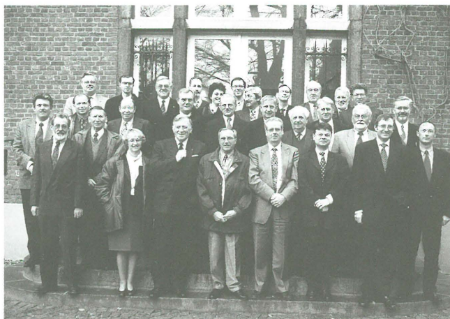
De leden van PBV.