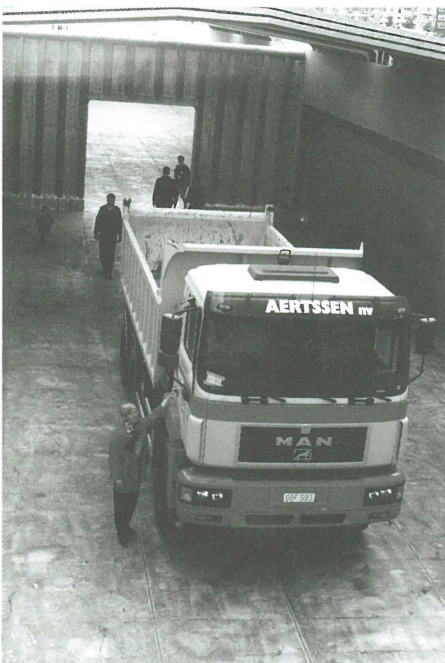
Portival 2002: een vrachtwagen in een binnenvaartreus.

Tijdens het weekend van 31 mei en 1 juni 1997 vond Portival 2002, een initiatief van het Havenbedrijf, plaats in Antwerpen. Met 250.000 bezoekers is dit evenement de grootste publiekstrekker in Vlaanderen. In het Kattendijkdok aan de Oostkaai te Antwerpen stelde Promotie Binnenvaart Vlaanderen een moderne binnenvaartvloot op: een duwbak met daarin een vrachtwagen, een droge ladingschip van 3150 ton en een tankschip van 2200 ton. Deze opstelling van Promotie Binnenvaart Vlaanderen was een groot succes. De grote capaciteit en de gespecialiseerde uitrusting van de binnenvaart werd zeer visueel voorgesteld. Het publiek kon op die manier met eigen ogen vaststellen hoe één binnenvaartschip vele vrachtwagens kan vervangen.