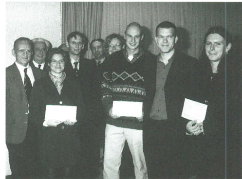
De 4 gelauwerde jongeren tijdens de prijstrekking.