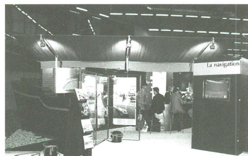
PBV en OPVN en BV/B op SITL

De samenwerking tussen de landen en instanties over de grenzen heen, die in de aanloop naar 2000 groeide, wordt geïntensifiëerd. Met name de contacten en informatie-uitwisseling met Wallonië en Nederland verlopen zeer positief. De gezamenlijke aanwezigheid op de beurzen : "Semaine Internationale du Transport et de la Logistique" (SITL)Parijs, "Transport '97" München en "Logistra" Duisburg zijn concrete voorbeelden van deze samenwerking.