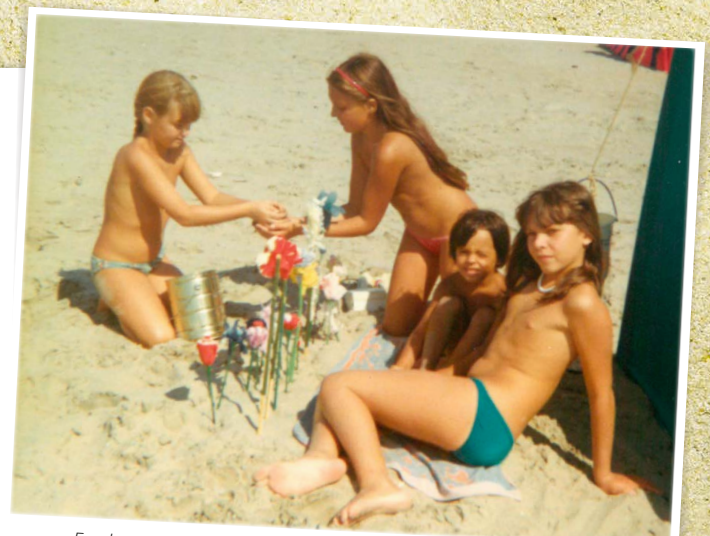
Een kraampje met strandbloemen op het strand van Zeebrugge tijdens de zomer van 1982.