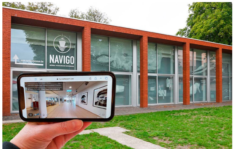
© Sofhie Legem - Gemeente Koksijde