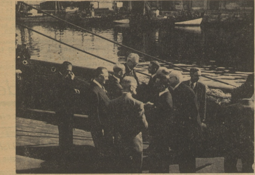
De heeren Ministers aan boord in druk gesprek.

Een kommandant van het echte ras, middelmatig van gestalte, flink gebouwd, met licht deinend gang zoodals het behoort aan een kind van zeevarende ouders, die zelf lang met zeilscheepsgevaar had vooraleer op de stoepschepen van de O-D Lijn terecht te komen. Wars van mooidoenerij en vreemde complimenten, kon hij de menschen die hem lastig vielen een ferm afstopper geven. Toen hij, op zijn beurt bevel voerde over het visscherijwachtschip, moest hij bij het aandoen eener vreemde haven het gebruikelijk beleefdheidsbezoek brengen aan den plaatselijken Belgischen consul. Daar zijn er nu ook onder van soorten: er zijn die die hun bezoeker gulhartig ontvangen en hem op een flink diner vergasten en, Charel den Ronden, die een goede maar had, slecht dat nooit van de hand. Maar er zijn ook consuls die dergelijke pleegvormen erg vervelend vinden en die hun bezoeker na eenige banale beleefdheidsstermen droogweg afschepen. Kommandant Charel moest nu met tegenzin dergelijk bezoek afleggen. Na een tijd wachten aan de deur, wat hem al veel te lang toescheen, werd hij door een plechtstatigen knecht