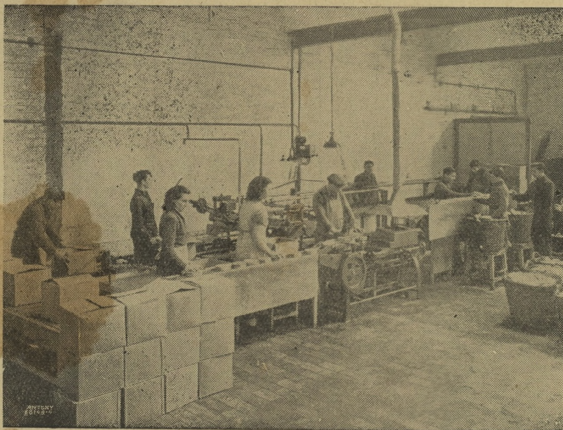
Haringseizoen ook in de verwerkende nijverheid