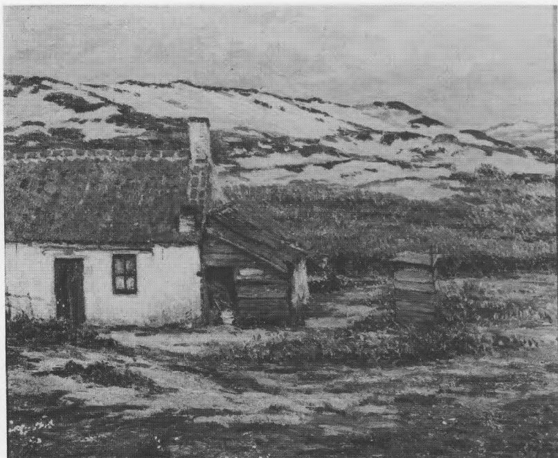
Afb. 3 — Rodolphe WYTSMAN Hoefetje in de duinen