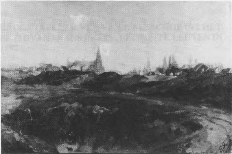
Afb. 8 — EMILE SACRÉ Landschap nabij Brussel

...doogen zandten. Als deelen is voorzien van de ...metalen, die aangesticht werden na het nemen van de leermark. Het zijn de gewoone «b» en de gekromde ...voorkop naar links, het meesmermerk 13 en de gekromde ...marciffers 82 voor het jaar 1782. In tegenstelling tot deze 18de- ...eeuwse merken, komt er ook een 19de-eeuwse herkeuringmerk op het bestek voor. Het betreft de golfische «s» waarin de lijnen des ...overvloeds en ook sterretje voorkomt. Dit herkeuringmerk werd gebruikt als vreesmerk of invoetmerk van 1811 tot 1809. Onderscheid van de esthetische vormgeving, gaat het hier om vrij veel voorkom- mend 18de-eeuwse burgerlijk tafeldiner.