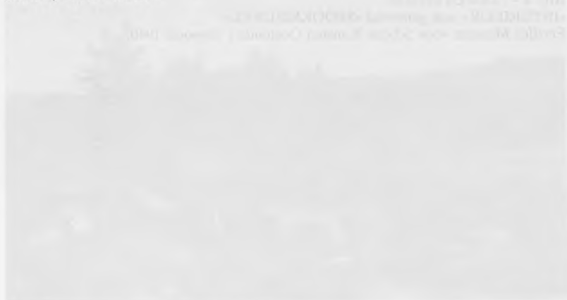
Afb. 4 — EDMONDHE BERNARDT «IN DE ARDENNES» olijf op doek 1891 August BERNARDT (1901)