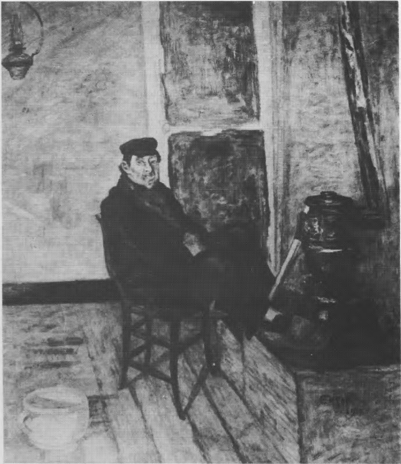
Afb. 2 — JAMES ENSOR

Luizenbos zich warmend aan een kachel (repliek uit 1910)