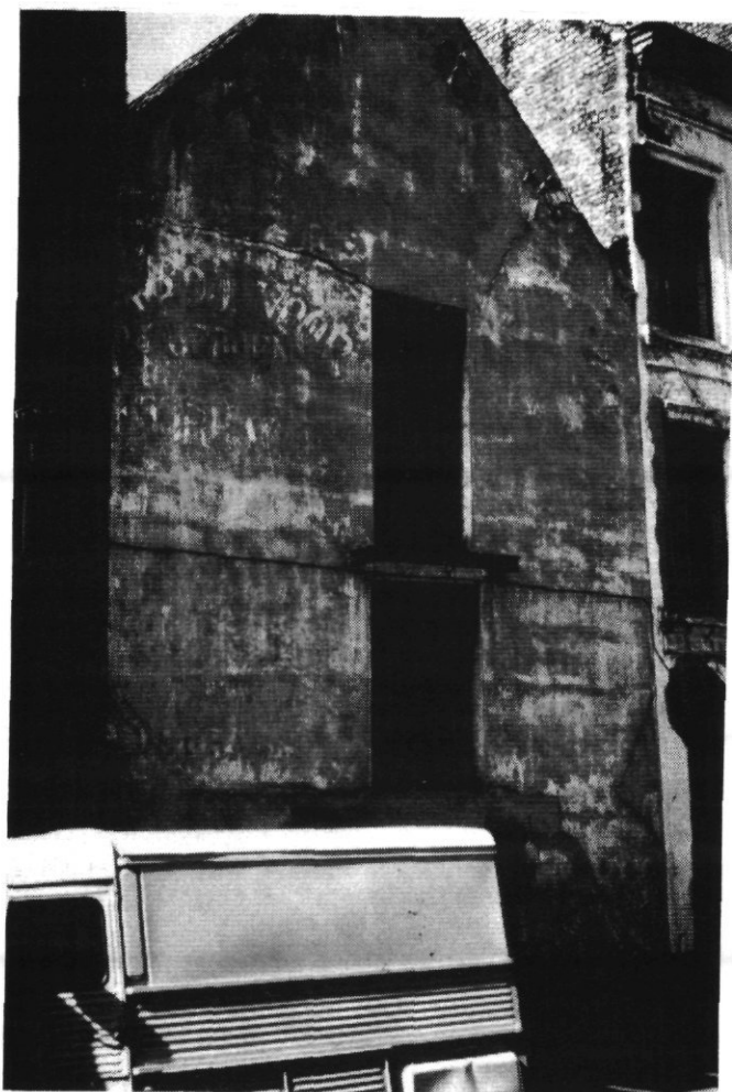
foto 1 : Stalling van Pierloot in de Sint Franciscusstraat. Eerste opvang voor vis in 1940. Op de gevel kan men nog lezen : Stroo voor bedden- Fourrages.