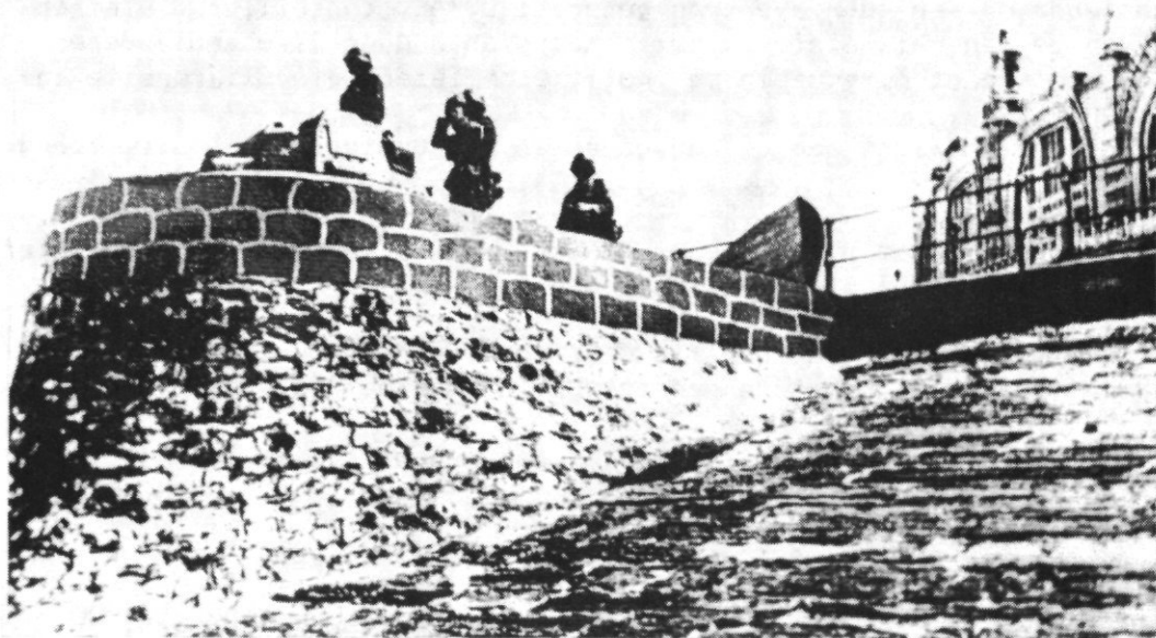
foto 3 : Belgische kustverdediging aan het Kursaal, hier in handen van de Duitsers.