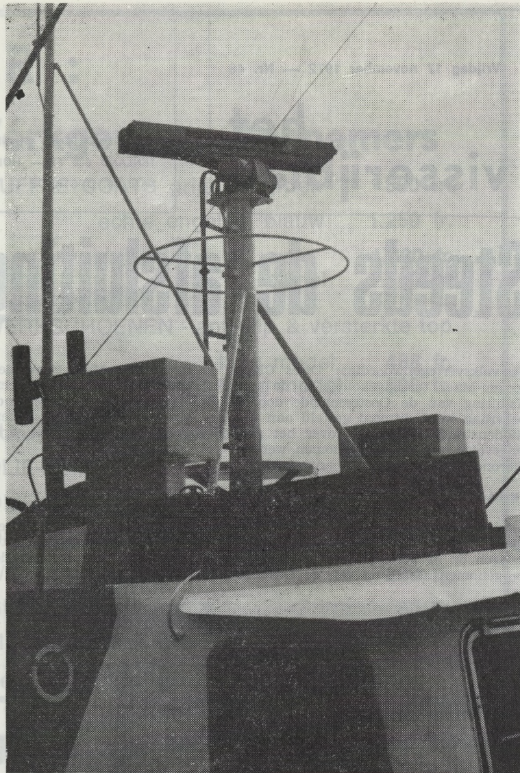
Schol, tong, kabeljauw en garnaal zijn producten van de Oosterschelde die ook wel wel de „kinderkamer van de Noordzee” wordt genoemd. Voorname vissoorten voor de Belgische vloot.

Reden voor deze verdwijning dient gezocht in de verslechtering van de milieu-omstandigheden, de onmogelijkheid om zich voort te planten en de verbreking van de normale trekcyclus van de dieren. Dat in de afgesloten Grevelingen of Oosterschelde ooit een zoetwatervisfauna van enige betekenis zal komen, kan nu reeds afgeschreven worden. Zoetwatervissen zijn over het algemeen sterk afhankelijk van de bodemfauna en het staat vast, dat in de zeer diepe geulen — de Oosterschelde is op sommige plaatsen inderdaad ettelijke tientallen meters diep — het zoute water zal stagneren. Hierdoor zullen zuurstoftekorten ontstaan, waardoor de ontwikkeling van de bodemfauna- en -flora ernstige schade zal ondervinden.