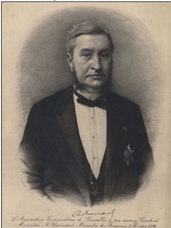
PT/H5 - "L'Association Conservatrice de Bruxelles à son ancien Président Monsieur A. Beernaert, Ministre des Finances, 3 Février 1886"

Precies 100 jaar geleden, in 1909, werd de Nobelprijs voor de Vrede toegekend aan een Oostendenaar, Auguste Beernaert. Voor velen is hij inderdaad een "nobele onbekende". Nochtans was Auguste Beernaert een "grote meneer" en dat in vele opzichten. Hoog tijd dus om de man die een monument kreeg op het Marie-Joséplein beter te leren kennen.