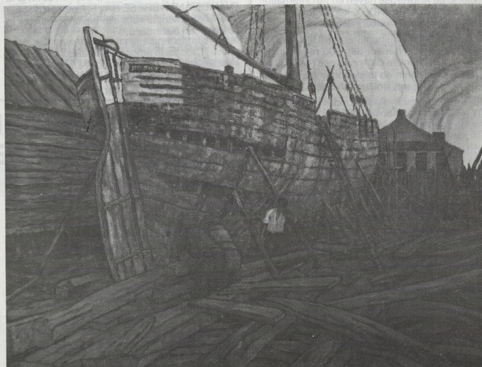
„De werf” — 1910