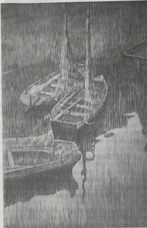
„Ter rust” — 1906