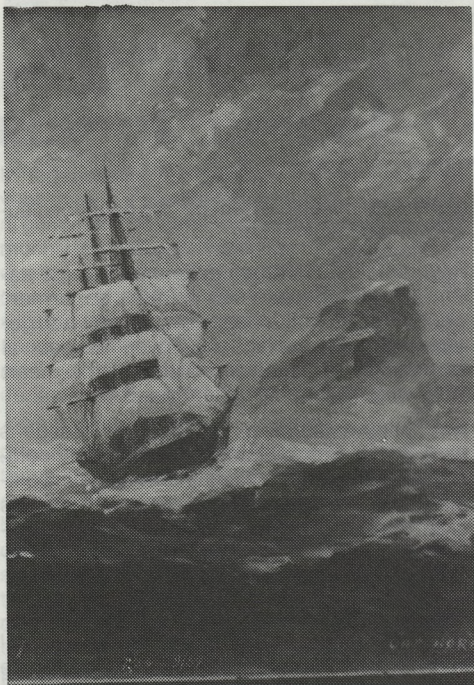
„Cap Horn” Schildering op het vensterluik van Royons woning te Freyr

Royon wist die elementen te combineren met een frisse, moderne, ietwat gestroomlijnde maar realistische vormtaal. Achteraf bekeken is zijn kunst een typisch exponent van de figuratieve kunst van de tussenoorlogse periode.