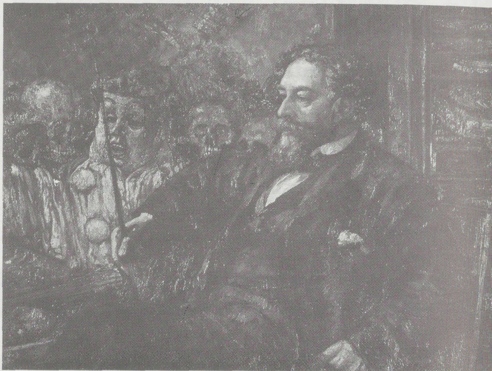
Ensor, geschilderd door zijn collega Henry De Groux (Oostende, Ensorhuis)

Eén van Ensor's eerste werken na zijn definitieve terugkeer te Oostende in 1880, was „Na de storm”, een marine vol subtiel-delicate licht- en kleurschakeringen, duidelijk brekend met elk