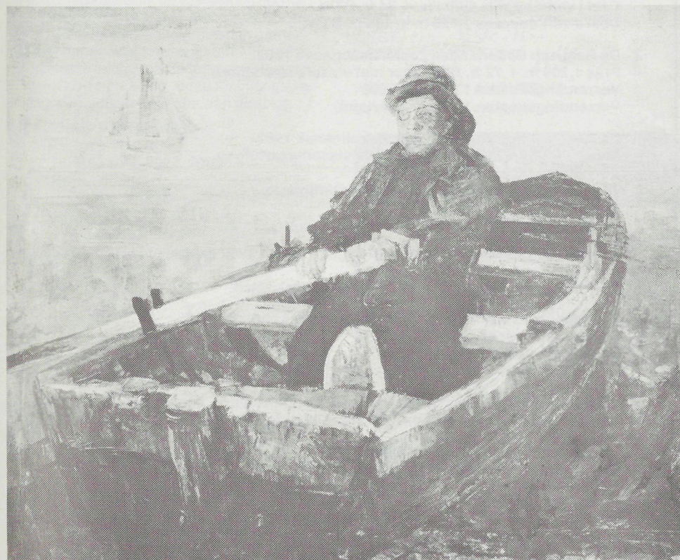
De Veerman – Impressionistische ode aan de Oostendse zeelui – (Antwerpen, K.M.S.K.)

Maar ook andere facetten van de zee boeiden Ensor : vissen en schelpen interesseerden hem omwille van hun kleuren en hun vormen, hun texturen. Hij sublimeerde ze in tal van schitterende stillevens, waarvan „De Rog” verreweg de meeste bekendheid geniet.