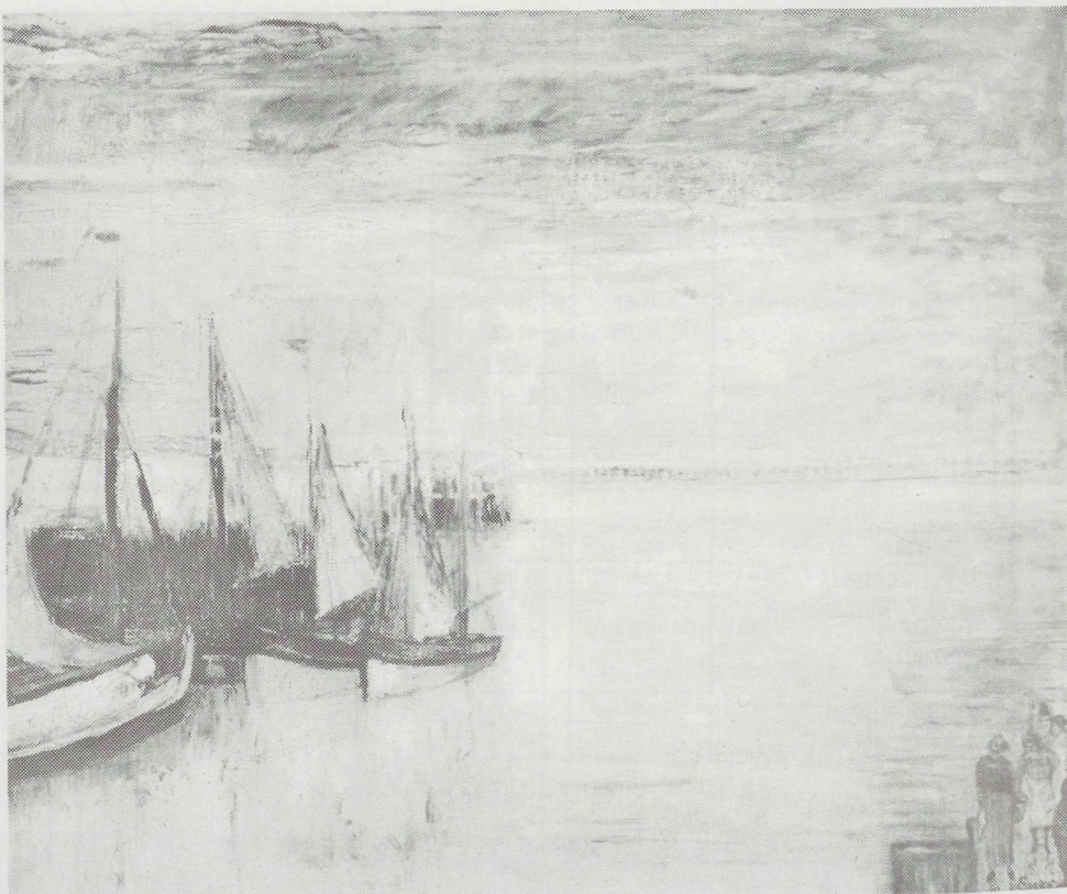
Vissershaven te Oostende – Destijds privéverzameling C.