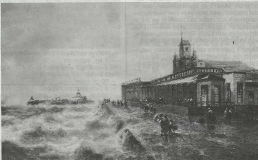
Haven en Zeedijk te Oostende.

wingen door Alban Chambon werden deze werken vervangen door frivole werken van Swyncop, Privat Livemont en Antoine Daens. Het beroemde ensemble verhuisde naar het stadhuis, waar het in de vlammen opging bij het uitbreken van W.O. II. Vier jaar eerder, na een Italiëreis in 1873, schilderde hij een reeks van 4 taferelen voor het huis van een Brusselse cliënte: Het Canal Grande te Venetië , Gezicht te Trieste , Gezicht te Rome en Gezicht te Napels . In 1884 decoreerde hij een ontvangtsalon in het hotel van Armand Stuers, burgemeester van Sint-Joost-ten-Node. Ook aan de inrichting van het Blankenbergse Kursaal werkte Musin mee. In 1885-1886 schilderde hij daarvoor onder meer een Zeeslag te Sluis . De koning van Württemberg kocht twee werken van hem, namelijk een Zicht op de Oostendse havengeul en een Zicht vanuit de Oostendse havengeul . Samen met de kostprijs stuurde deze mecenas ten teken van zijn grote waardering aan Musin. een briljanten ring. Een ander gekroonde onder Musin's afnemers was Nasserdin chah Kadjar, die in 1873 te Londen zijn Strand te Zuydcoote kocht.