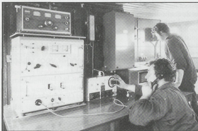
Deze foto vonden we terug in onze oude doos. Ze stamt van vóór de tijd dat we HVB in 1988 overnamen. We weten niet wie de personen op deze foto zijn en evenmin waar en wanneer de foto genomen werd. Kan iemand ons helpen gegevens betreffende de foto terug te vinden? Laat het ons weten op het.visserijblad@telenet.be of op tel 0474 53 88 00.

Na 100 jaar technologische vooruitgang en internationale organisatorische ontwikkelingen in de maritieme radiowereld zijn de punten en strepen, samen met de marconisten, verdwenen. Een nieuw wereldomvattend maritiem nood- en veiligheidssysteem kwam tot stand en de meeste kuststations sloten hun deuren. Als een van de weinigen overleefde Oostende Radio deze omwenteling.