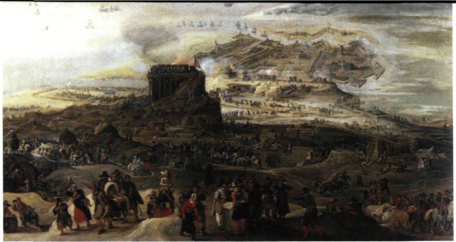
Het Beleg van Oostende, gezien vanuit het kamp van de belegeraars. Let op het grote bouwsel dat vuur vat. 'De grote kat' wordt door de geuzen in brand geschoten. ( http://upload.wikimedia.org/wikipedia/commons/6/63/Sitio_de_Ostende.jpg )

Zo kon het niet blijven duren. Albrecht ging aankloppen bij Ambrogio Spinola, een steenrijke Italiaan. In ruil voor geld