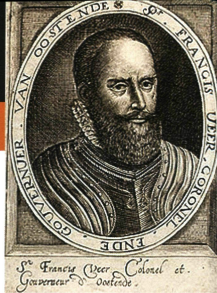
De Brit Francis Vere (1560-1609) was opperbevelhebber van de Geuzen in Oostende. Nadat de Engelse koning James vrede sloot met Spanje, ging Vere met pensioen. Zijn ervaringen schreef hij op in Commentaries of the Divers Pieces of Service . Vere stierf in 1609, vlak nadat de Nederlanden het Twaalfjarig Bestand (een onderbreking van de Tachtigjarige Oorlog) hadden gesloten met Spanje. Hij werd begraven in de Westminster Abbey. ( http://nl.wikipedia.org/wiki/Francis_Vere )

De autochtone Oostendenaars hadden de bui al van ver zien aankomen en ze hadden dan ook hun biezen gepakt. 'En waar schuilt die bedrijvige bevolking, visschers, weerden, reeders, schippers, handelaars en werklieden? (...) Waren er dan geene inwoners tot na het beleg van te Oostende gebleven? Je... één zegt de Bisschop van Brugge (...) Twee zegt