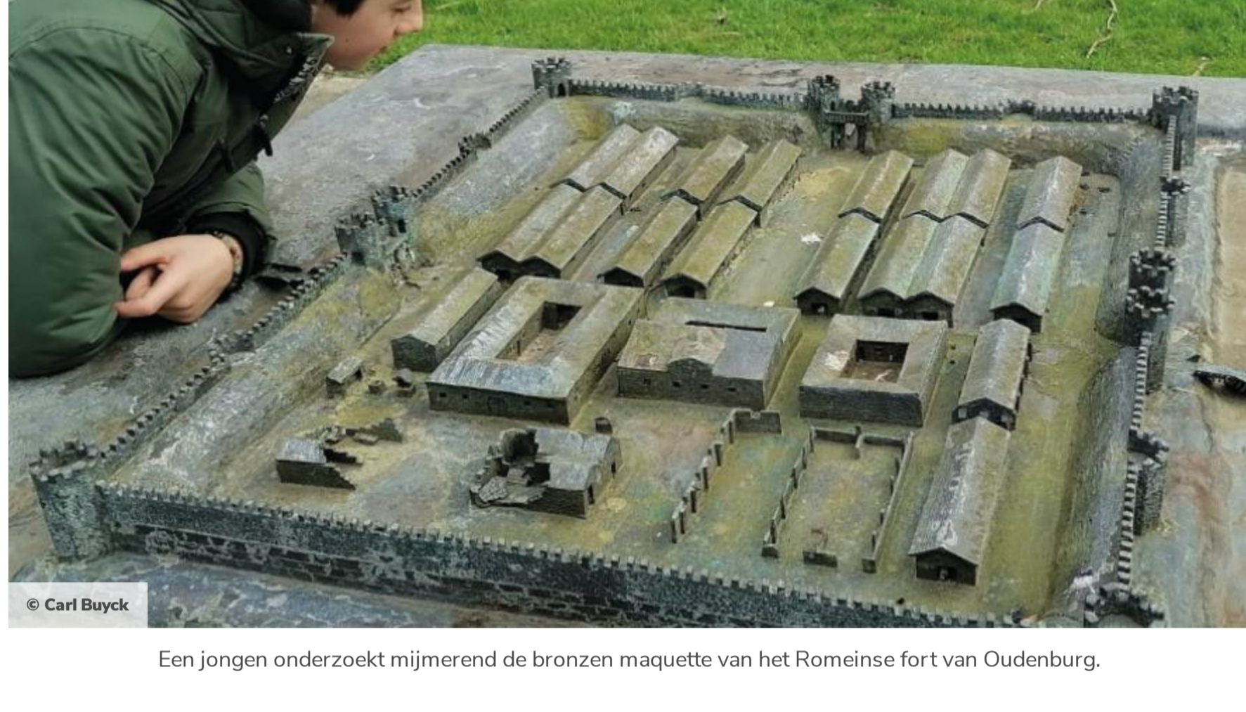
Een jongen onderzoekt mijmerend de bronzen maquette van het Romeinse fort van Oudenburg.

Militaire havens waren er niet alleen bij vlootbases. Net zoals de forten langs de Rijn grens waren ook de kustforten voorzien van aanlegplaatsen voor schepen. Deze aanlegplaatsen namen meestal de vorm aan van een eenvoudige aanlegsteiger in hout of, vaker nog, van een met palen en planken beschoede waterkant die dienstdeed als kade. Zo zorgde de Bredenegeul ervoor dat er zich rond het midden van de eerste eeuw een bloeiende handelsnederzetting met bijhorende haven kon ontplooiën in Oudenburg. In de Laat-Romeinse tijd lag die haven aan de noordzijde van het Oudenburgs fort. Misschien is deze haven wel het Portus Aenapiacus vermeld in de Notitia Dignitatum, een document uit de vroege vijfde eeuw dat een overzicht geeft van alle administratieve en bestuurlijke functies in het Romeinse Rijk. De term 'portus' veronderstelt dat het niet gaat om een eenvoudige aanlegplaats voor kleine vissersboten, maar om een grotere, goed beschermde aanlegplaats waar boten konden 'overwinteren'. Ook in Aardenburg was er een haven bij het Romeinse fort. Archeologen lokaliseren deze op circa 500 m ten noordwesten van het fort, langs de getijdengul die in verbinding stond met de Noordzee.