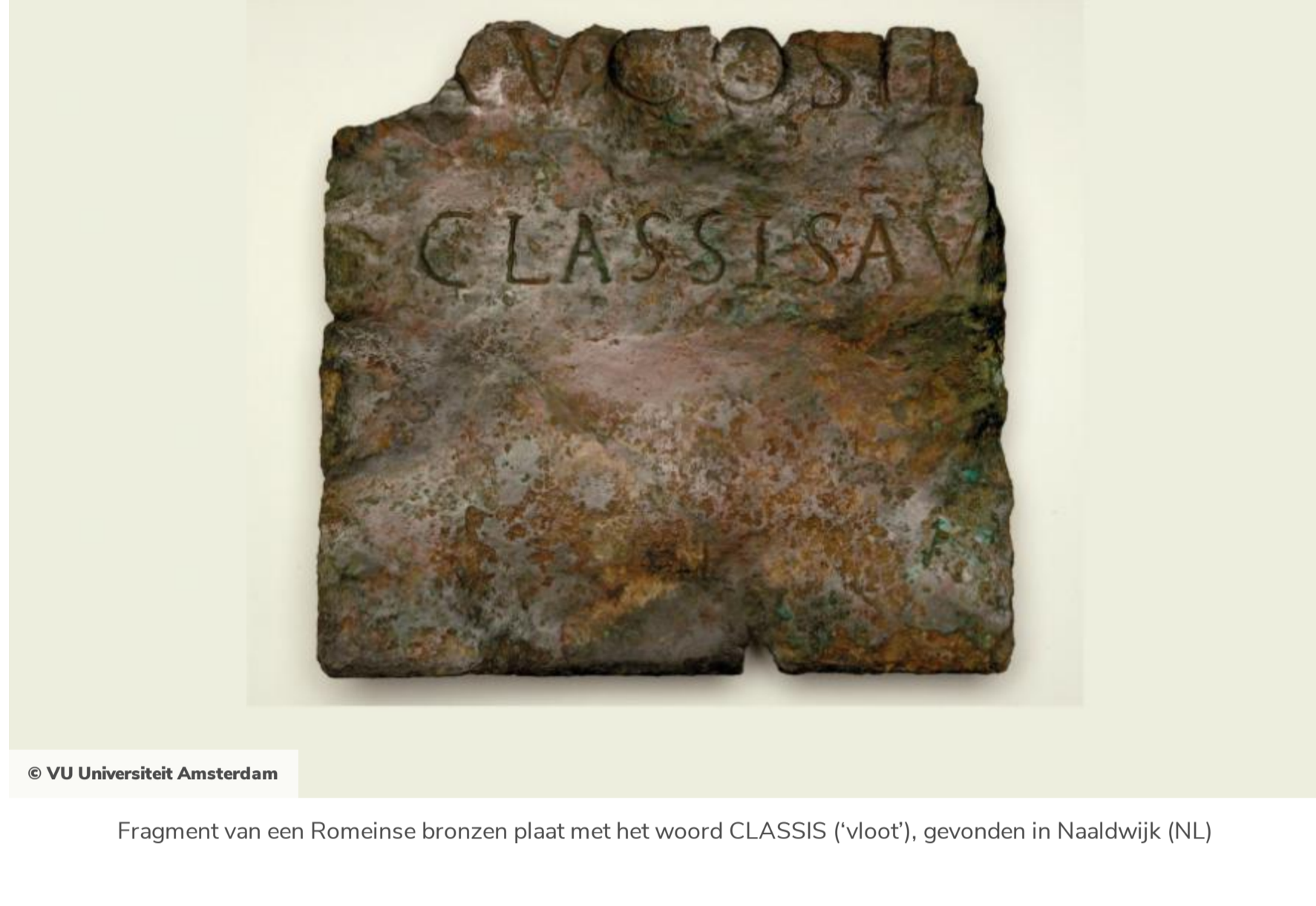
Fragment van een Romeinse bronzen plaat met het woord CLASSISA ('vloot'), gevonden in Naaldwijk (NL)

Er is slechts één site die voldoet aan alle criteria voor een vlootbasis, namelijk Boulogne-sur-Mer, de vlootbasis van de classis Britannica. Die vloot verzekerde onder meer de communicatie met de Romeinse provincie Britannia en was vooral actief in de Kanaalzone. De tegenpart van deze vloot was de classis Germanica, die onder meer betrokken was bij grote watertechnische infrastructuurwerken in het Nederlandse rivierengebied, zoals het graven van kanalen en het aanleggen van dammen en duikers, maar ook het droogleggen van veengebieden. Het is mogelijk dat deze vloot ook vlootbases had in Naaldwijk, aan de monding van de Maas en een aan de monding van de Schelde, in het Zeeuwse natuurgebied Oostkapelle-Oranjeston.