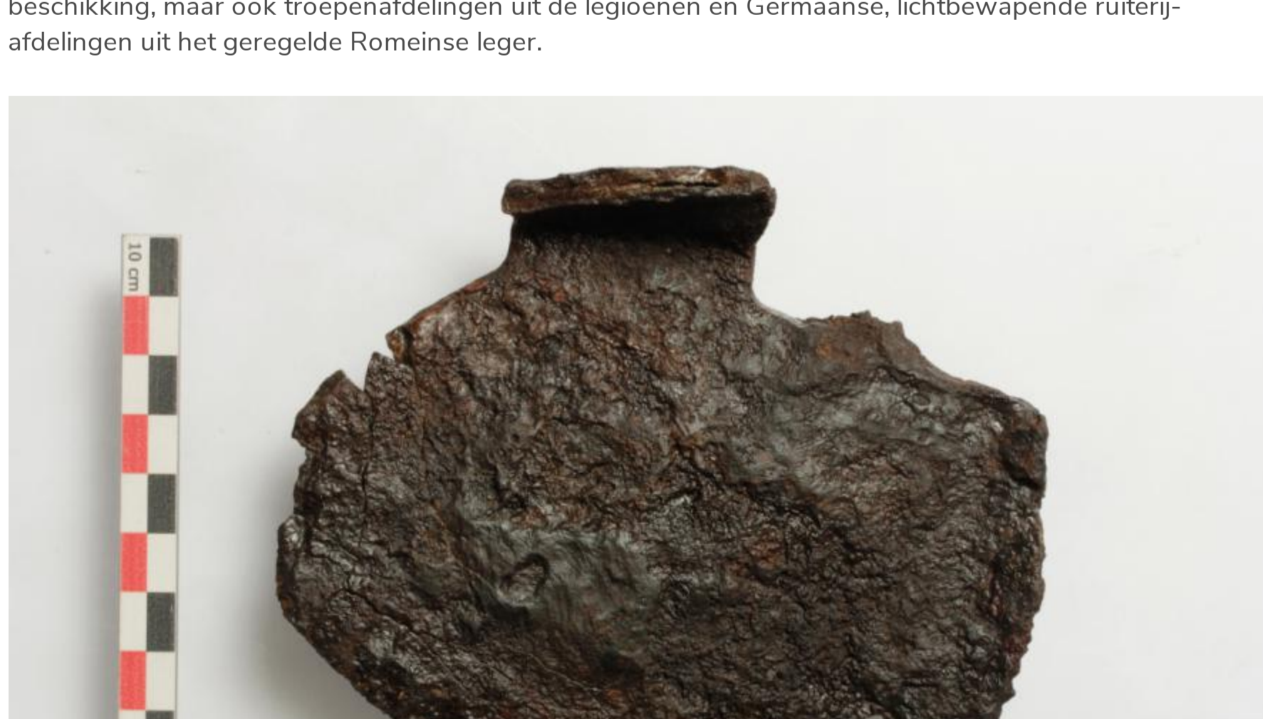
Een hippo sandaal (voorganger van het moderne paardenhoefijzer) aangetroffen in het Romeinse fort van Oudenburg.

Soms volstond een militaire aanwezigheid in de kustforten niet en paard men buitengewone commando's in het leven. Zo kon men een uitzonderlijke dreiging het hoofd bieden, zoals toen keizer Maximianus in het jaar 286 Carausius aanstelde om de Germaanse piraten die de Gallische kusten teisterden hand aan te pakken. Carausius had voor zijn opdracht tegen die piraten niet alleen de classis Britannica tot zijn beschikking, maar ook troepenafdelingen uit de legioenen en Germaanse, lichtbepawende ruitertij-afdelingen uit het geregelde Romeinse leger.