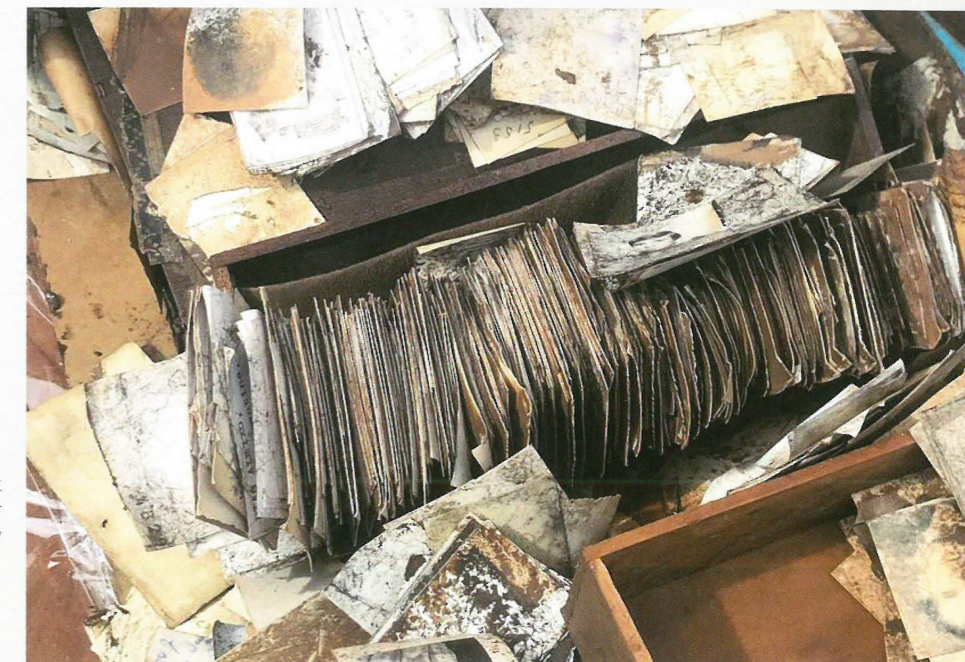
Foto's uit het archief van Trooz bedekt met een laag modder