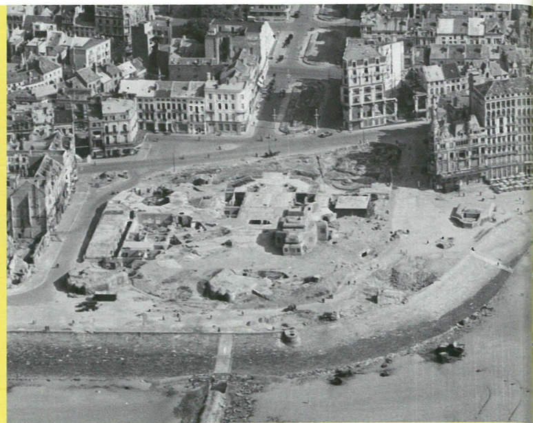
Hier zien we de impressionante geschutsbunkers en observatie- en vuurleidingsbunker van kustbatterij MKB Kursaal. Slechts de contouren van enkele muurresten herinneren aan het casino-kursaal dat in 1942-1943 op deze plek werd afgebroken. Dat maakte toen plaats voor de kustbatterij. Boven op het platte dak bevond zich de afstandsmeter van de vuurleidingsbunker. Op de dijk zijn nog drie betonnen kazematten voor geschut te zien. De vierde werd tot ontploffing gebracht. Alleen een krater met puin blijft over