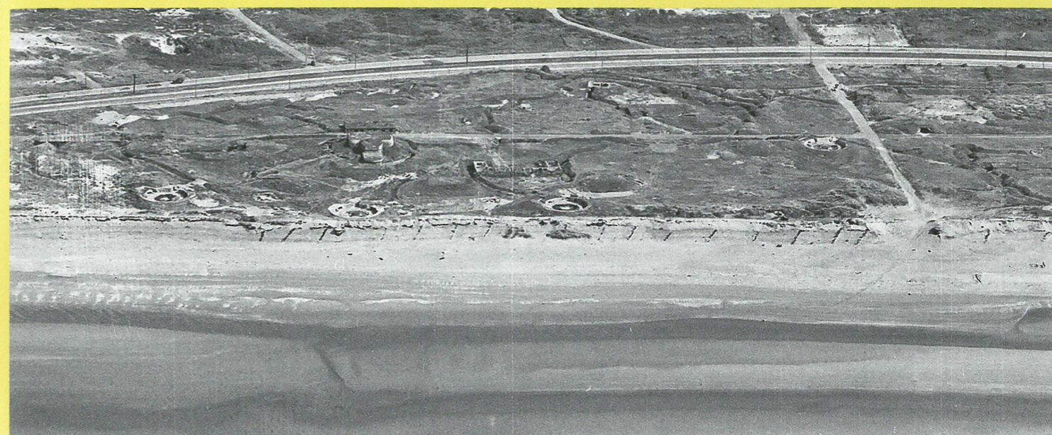
Vanuit een positie in het achterland verhuisde kustbatterij HKB Groenendijk-Plage in 1943 naar deze plek aan de duinen. Er bevonden zich zes betonnen beddingen voor openluchtgeschut. Tijdens de bevrijding werd de batterij tussen 9 en 12 september 1944 aangevallen door Canadese troepen

dit was iets speciaals. Een Amerikaanse verkenningmissie maakte de reeks op 4 augustus 1945. Tijdens een 100 km lange vlucht tussen Zeeland en het noorden van Frankrijk werden meer dan 240 foto's genomen, het grootste deel langs de Belgische kustlijn. Vanop zeer lage hoogte kwam de volledige kustlijn in beeld. Het unieke is dat het niet gaat om één foto, maar dat het ene na het andere beeld zich opvolgt, zonder ook maar één meter kustlijn over te slaan. En de foto's werden schuin genomen, vanuit zee met zicht op de branding, het strand,