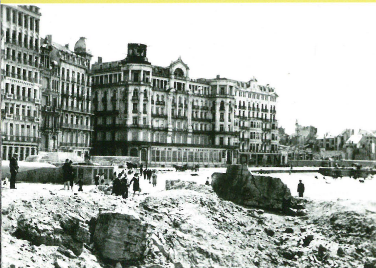
De locatie van het vroegere casino met op de voorgrond het puin van de ontplofte bunker, en daarachter één van de overgebleven geschutsbunkers met opgeschilderde ramen en deuren als camouflage

Amerikaanse nationale archieven op zoek te gaan naar luchtfoto's van Vlaanderen uit de Tweede Wereldoorlog. Ze troffen er zowel Amerikaans als Duitse foto's aan die daar beland zijn door het veroveren van Duitse archieven bij de terugtrekking en de bevrijding in 1944-1945. In die archieven bevinden zich enkele miljoenen Amerikaanse luchtfoto's uit die periode, die het strijdtoneel wereldwijd bedekken. Ze worden op filmrollen in metalen containers bewaard in een ondergrondse opslagfaciliteit in Kansas.