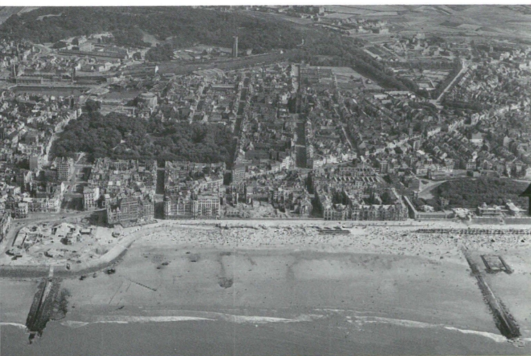
Het centrum van Oostende met links de locatie van het afgebroken Casino Kursaal en daarachter het Leopoldpark, en rechts de Venetiaanse Gaanderijen en de Torhoutsesteenweg