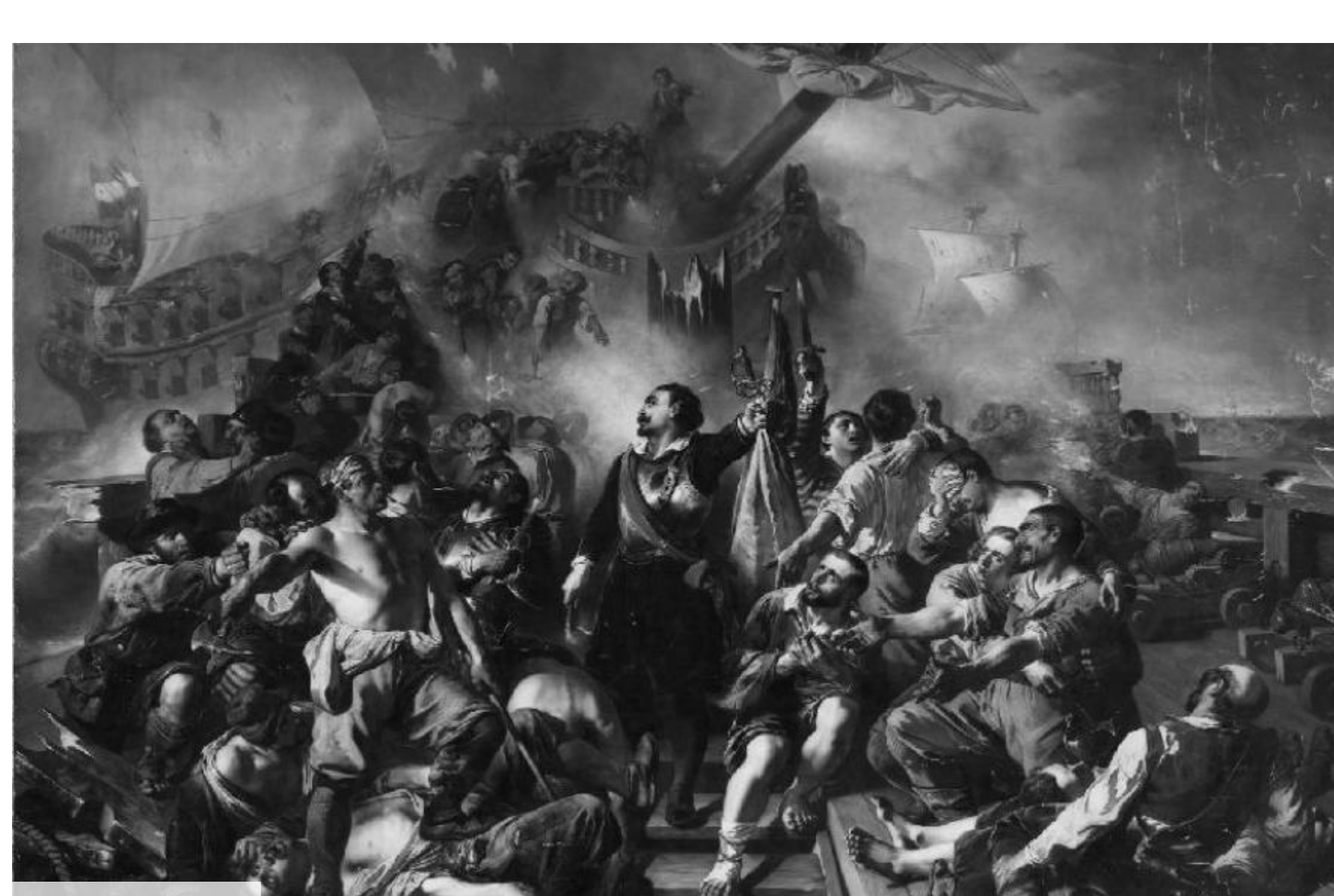
La Mort de Jacobsen door Ernest Slingenyver (1845)

Wat er ook van zij: de kapitein zelf mocht dan amper 33 jaar geworden zijn, zijn legende was een lang leven beschoren. De negentiende-eeuwse romantiek vond in Jacobsen alles wat de kunststroming begeerde: traagiek, heroïek en geschiedenis. De Belgische kunstenaar Ernest Slingenyver beeldde de gebeurtenissen van oktober 1622 af op een monumentaal doek (het werk meet 6 bij 4,5 meter) en sleepte er op het salon van 1845 de eerste prijs mee in de wacht. Niemand minder dan koning Leopold I kocht het schilderij ter verfraaiing van het paleis van Laken.