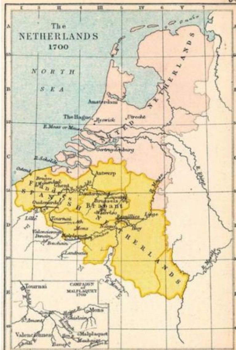
The Public Schools Historical Atlas

In 1622 duurde het bloedvergieten tussen noord en zuid al 54 jaar. Of 64 jaar, het hangt ervan af hoe je het bekijkt. Tussen 1609 en 1621 hadden Spanje en de Republiek immers een pauze ingelast. Vredel Generaties waren opgegroeid zonder de betekenis van het woord te kennen. Landvoogden Albrecht en Isabella vulden het begrip in met rust, een prachtige citadel in Scherpenheuvel en processies, veel processies, waarop ze zelf graag acte de présence gaven. Maar bij de afloop van het Twaalfjarig Bestand bleek de vechtlust nog niet gestild, en begon deel twee van wat de Tachtigjarige Oorlog zou gaan heten.