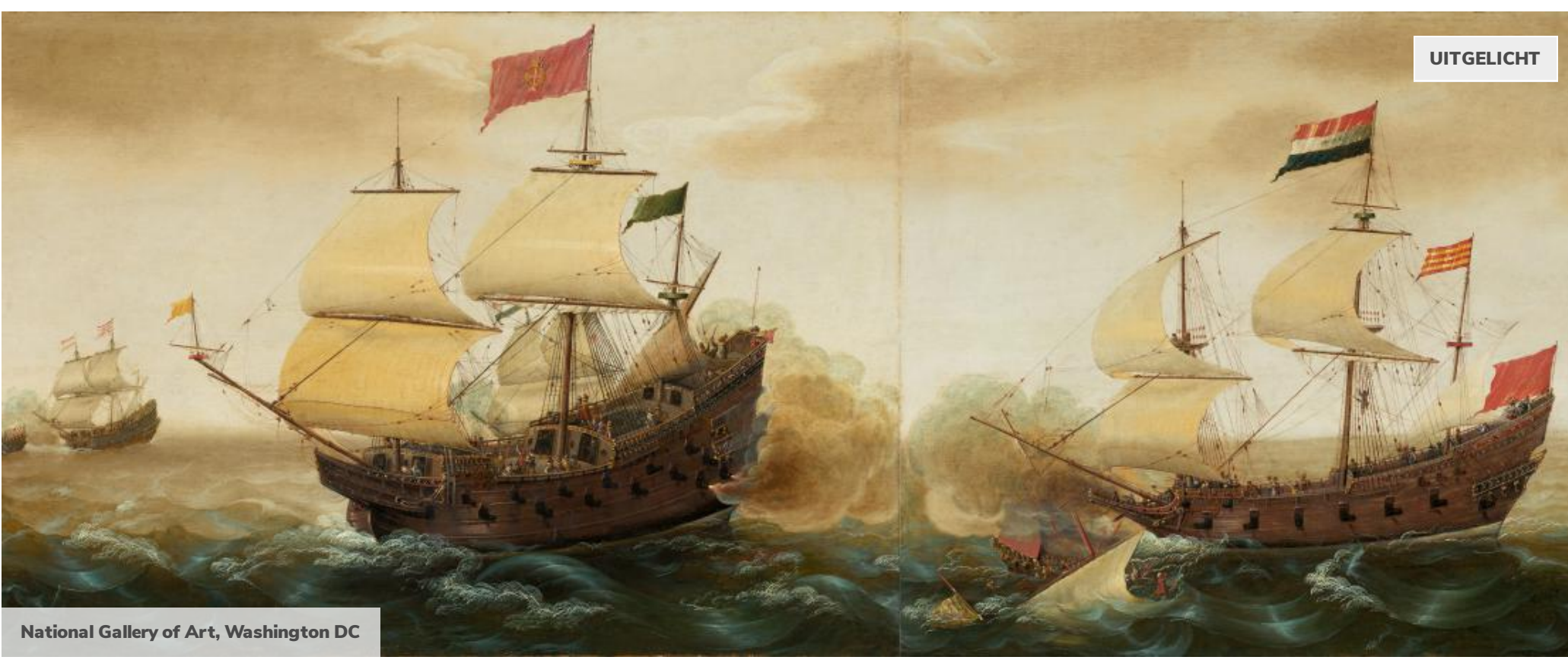
National Gallery of Art, Washington DC