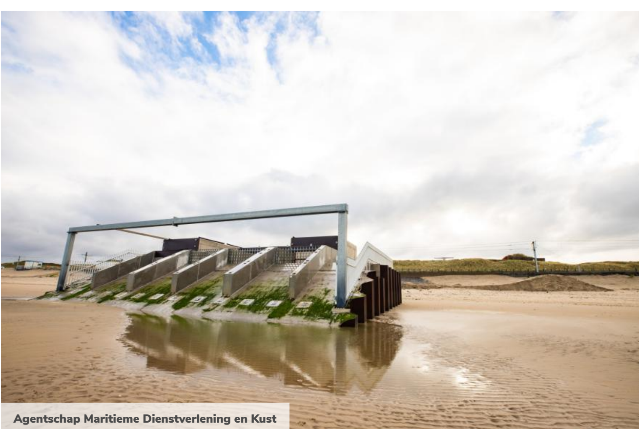
Agentschap Maritieme Dienstverlening en Kust