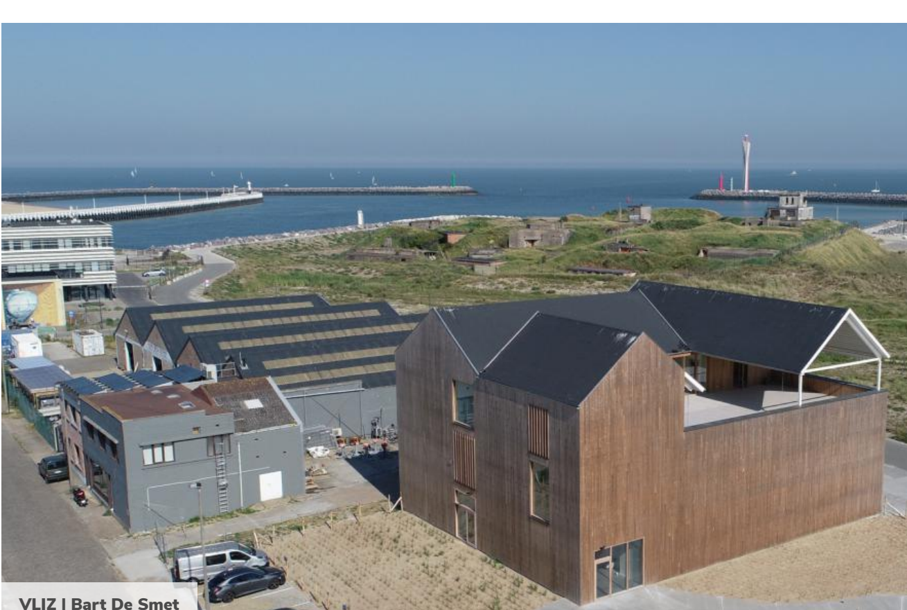
VLIZ | Bart De Smet