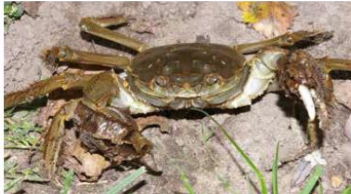
Chinese wolhandkrab

De omvang van het visbestand in de Boven-Schelde is geschat op