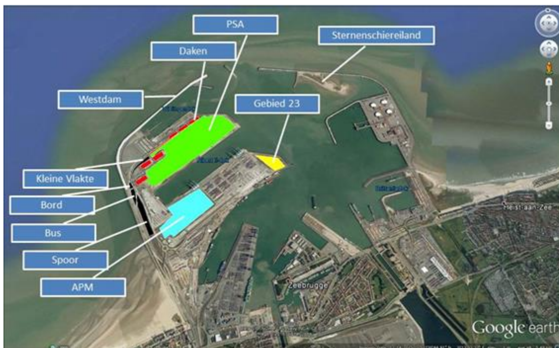
Figuur 2. Kaart van de voorhaven van Zeebrugge met aanduiding van de belangrijkste broedgebieden voor grote meeuwen.