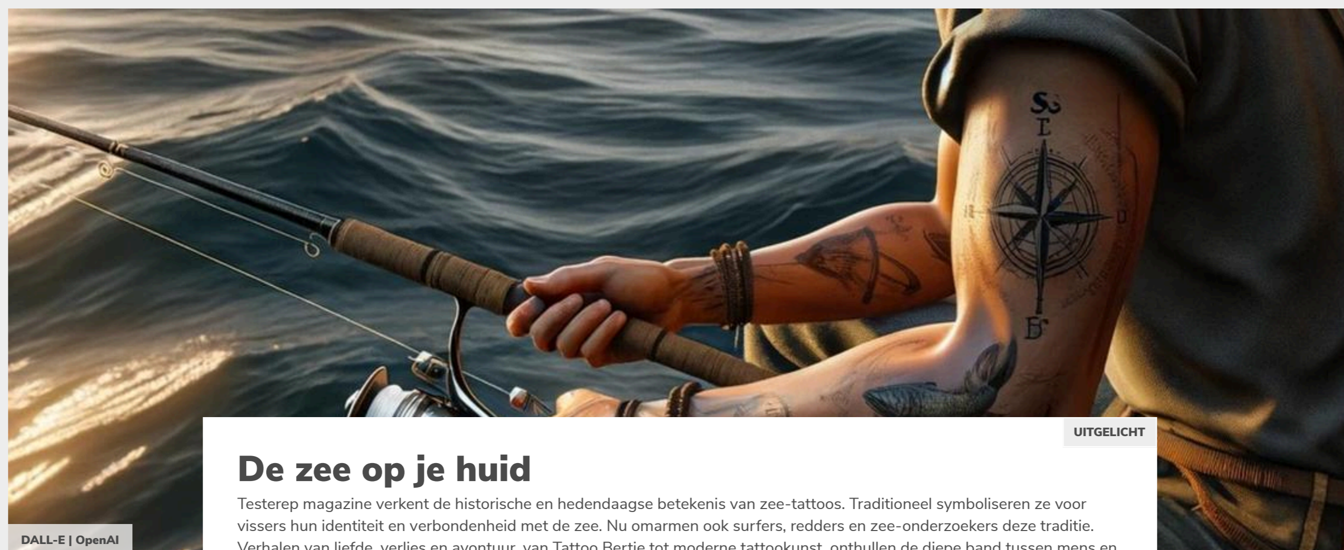
DALL-E | OpenAI