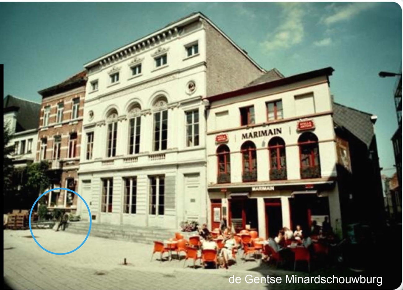
de Gentse Minardschouwburg