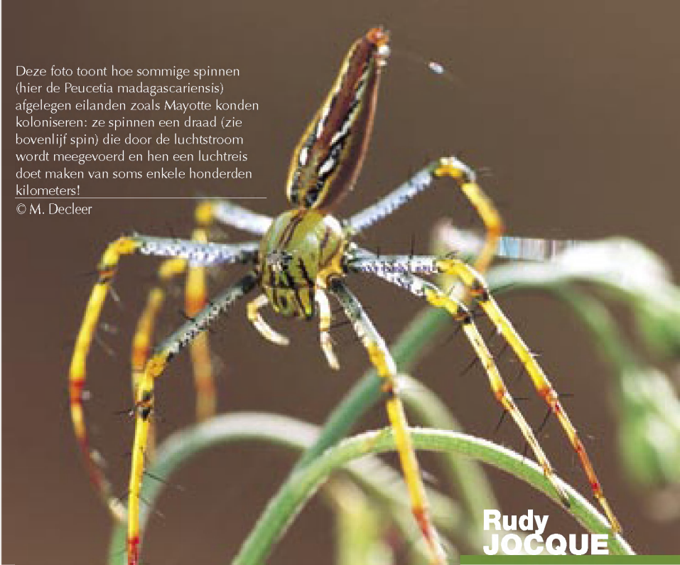
Deze foto toont hoe sommige spinnen (hier de Peucetia madagascariensis ) afgelegen eilanden zoals Mayotte konden koloniseren: ze spinnen een draad (zie bovenlijf spin) die door de luchtstroom wordt meegevoerd en hen een luchtreis doet maken van soms enkele honderden kilometers!