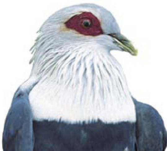
De founingo van de Comoren, Alectroenas sganzini sganzini , een endemische vogel.

■ In 1988 verscheen een eerste boek getiteld: "Les oiseaux des Comores" , gepubliceerd in de reeks "Annalen van het KMMA".