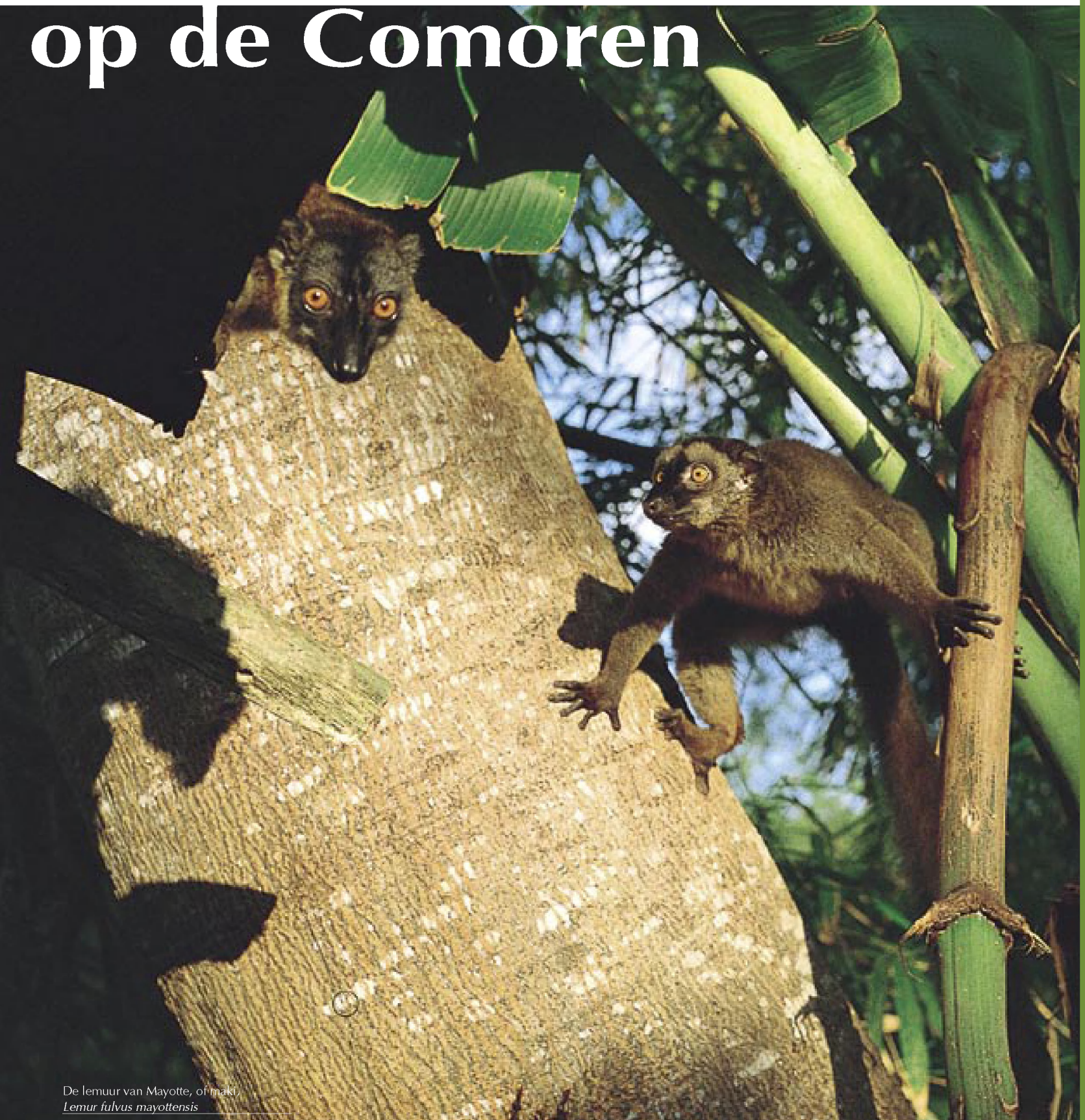
De lemuur van Mayotte, of maki, Lemur fulvus mayottensis