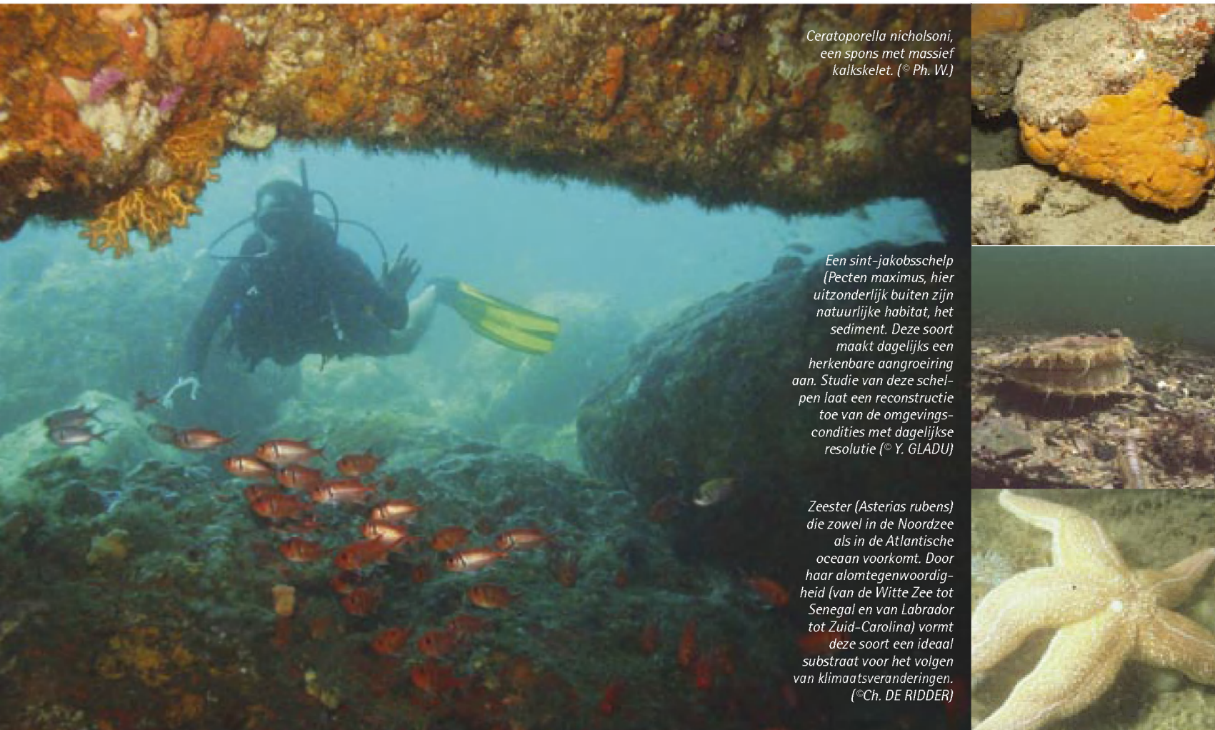
Ceratoporella nicholsoni , een spons met massief kalkskelet.

heden aan dat het metabolisme van het organisme een grote invloed kan hebben op de chemische samenstelling van de shell, en het niet in rekening brengen hiervan kan leiden tot foutieve interpretaties van de proxysignalen in de shells. Om meer inzicht te verkrijgen in de verschillende stappen die leiden tot de verwerking van het milieusignaal in de shell wordt in nauwe samenwerking met het Institut Universitaire Européen de la Mer (IUEM, Brest, Frankrijk) niet enkel de chemische samenstelling van de shell en het zeewater bestudeerd, maar ook die van de weefsels, de hemolymfe en het vocht tussen mantel en shell (van waaruit de opbouw van de shell plaatsgrijpt). Resultaten tonen voor sommige elementen sterke verschillen aan tussen fysiologisch vocht en zeewater. De samenstelling van de shell zal dan uiteindelijk ook bepaald worden door deze van het zeewater en de fysiologie van het organisme. Een robuuste ijking van de proxysignalen opgeslagen in de kalkskeletten aan de externe controlefactoren, vereist dan ook eerder een proefondervindelijke dan een empirische aanpak.