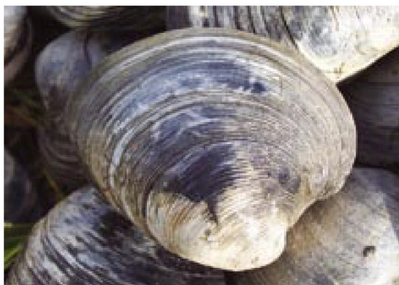
Mercenaria mercenaria