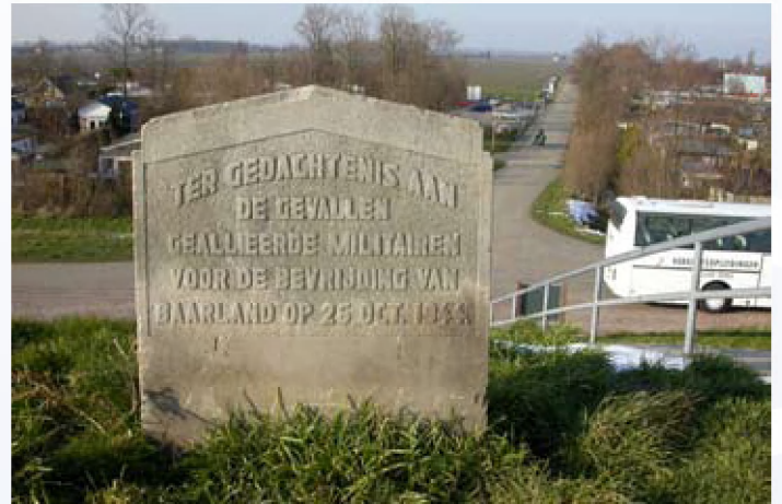
Monument op de Scheldebijk bij Baarland