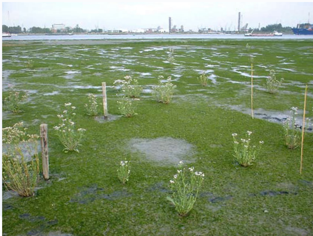
Hoge bedekkingen van Nopjeswier in combinatie met zeeaster op Ketenisse