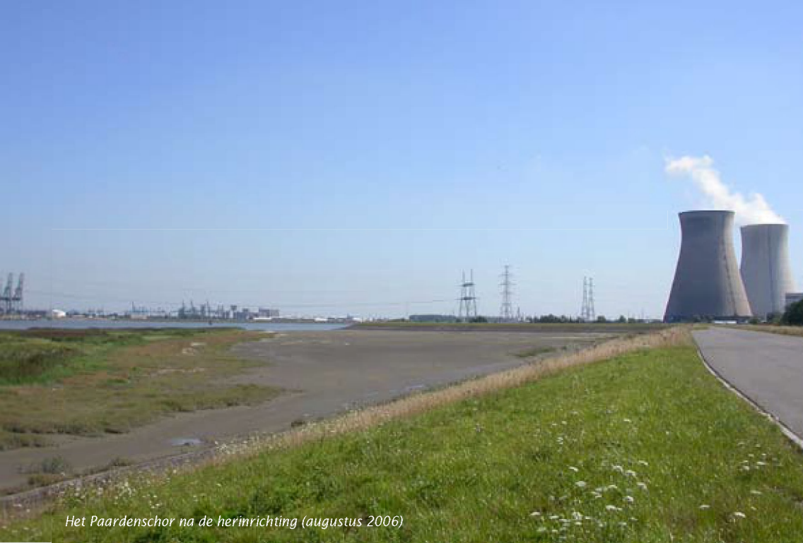
Het Paardenschor na de herinrichting (augustus 2006)

april 2004 was het “nieuwe Paardenschor” een feit. Het tweede projectgebied, Ketenisse, telt 60 ha (waarvan 35.5 ha heringericht) en is gelegen tussen de Kallosluis en de Liefkenshoektunnel. Ook in dit gebied had de natuur moeten inboeten, want de specie die bij de aanleg van deze beide constructies vrijkwam, werd op delen van Ketenisse gedeponneerd en de andere delen waren ingepolderd. Maar als compensatie voor de bouw van de Noordzeecontainerterminal in 1994, werd ook dit gebied afgegraven tot hoog slikniveau. De herstelwerkzaamheden duurden van december 2001 tot januari 2003.