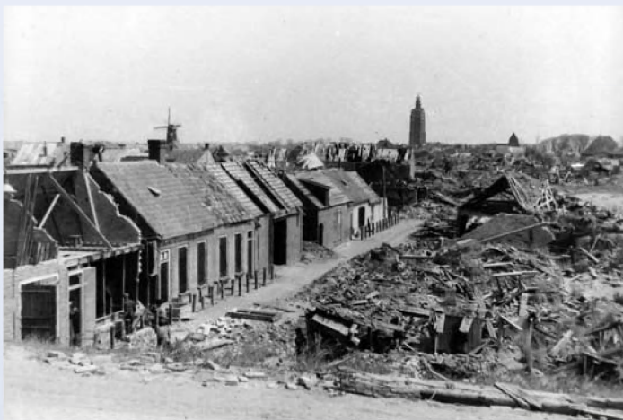
Westkapelle werd voor een groot deel verwoest

de geallieerden daarom dringend behoefte aan deze grote aanvoerhaven dichtbij het front én de heerschappij over de vaarroute naar deze strategisch belangrijke haven. Begin september 1944 vielen de geallieerden zegevierend Antwerpen binnen. Ze troffen de haven vrijwel intact aan, want Belgische verzetsstrijders hadden de haveninstallaties behoed voor vernieling door terugtrekkende Duitsers. Maar daarmee was de broodnodige aanvoerhaven nog niet zeker. Voor een veilige doorvaart over de Schelde moesten de geallieerden eerst nog de Schelderegio zuiveren van Duitse troepen en gevechtsinstallaties. En de vaarroute lag vol Duitse mijnen. Bovendien onderkende de Duitse generale staf dat een vrije doorgang naar Antwerpen van cruciale betekenis was. Daarom had de vijand zijn verdediging langs de Schelde-oever versterkt en het vergde dan ook zware strijd ten koste van grote