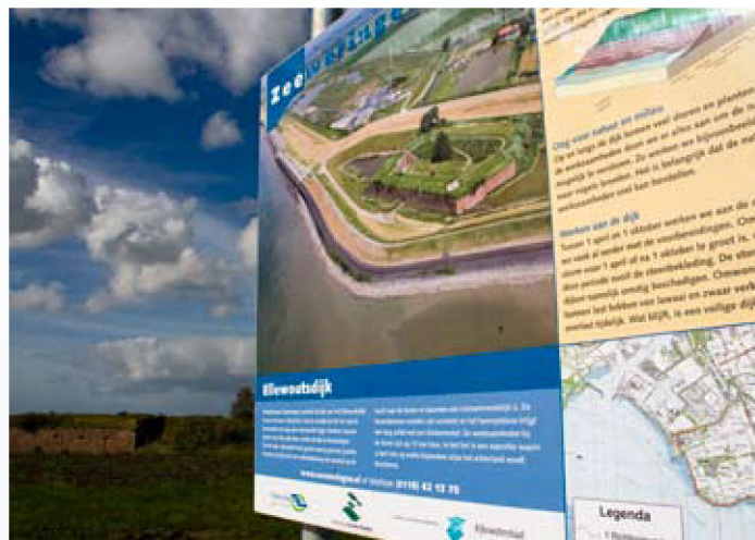
Informatiepaneel op de dijk met op de achtergrond Fort Ellewoutsdijk

mingsgebieden de kans op wateroverlast beperken. Tina Stroobandt, communicator van het Kruibeekse overstromingsgebied, wijst op het verschil in invalshoek. ‘De projectgebieden liggen landinwaarts, waardoor niet zozeer hoog en laag water voor gevaar zorgen, maar eerder extreem stormtij. Een stormgolf die van zee de Schelde wordt ingestuwd, rolt door een steeds smaller keurslijf het binnenland in. Door net op het goede moment de top van de golf af te snijden en gecontroleerd in een afgeback gebied te laten stromen, kan je problemen elders vermijden. Uiteraard zou het zonde zijn een oppervlakte van meer dan 650 hectare enkel als waterberging in te zetten. Door verschillende functies te combineren in het projectgebied, stijgt de waarde voor alle betrokkenen. In Kruibeke gaat de meeste aandacht naar nevenfuncties als natuur en recreatie.’