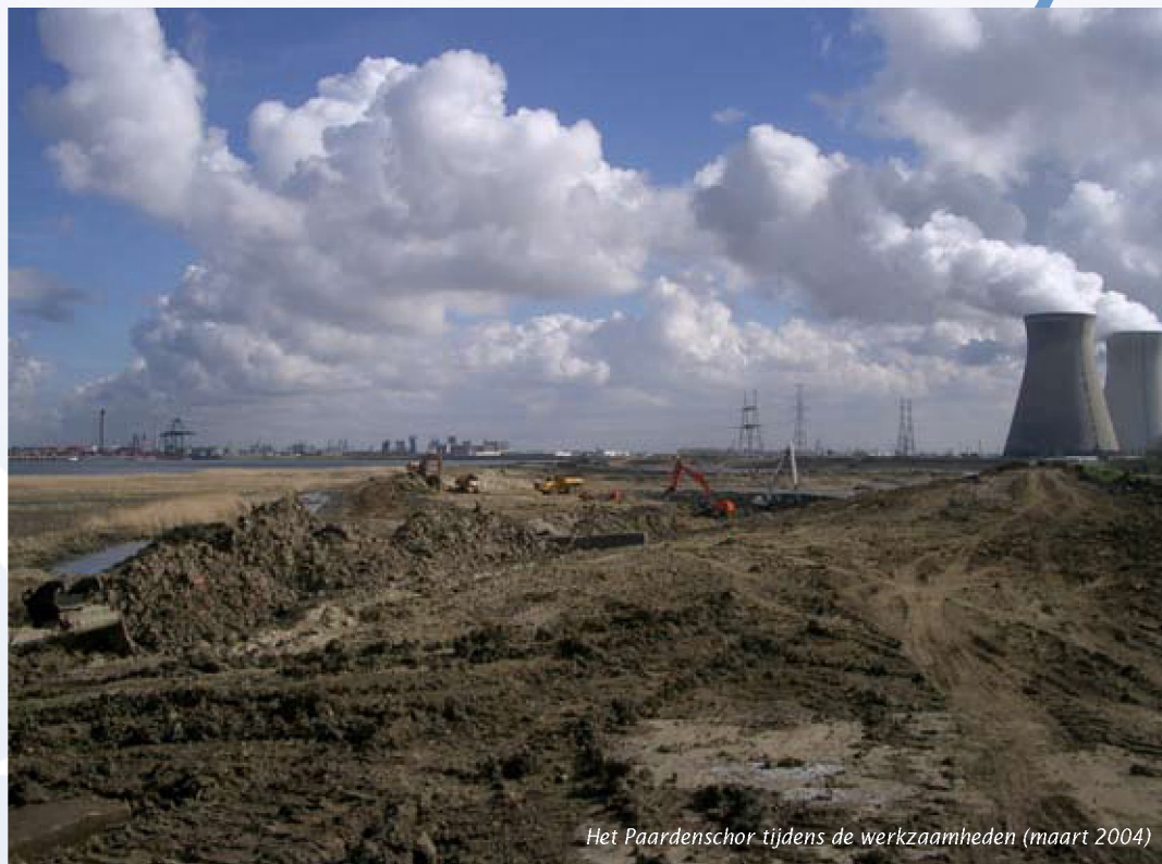
Het Paardenschor tijdens de werkzaamheden (maart 2004)

De Vlaamse Regering wil vaart maken met het ecologisch herstel van het Zeescheldebekken, zo blijkt uit haar besluiten over de actualisatie van het Sigmaphan en de Ontwikkelingsschets 2010. Een belangrijke uitdaging daarbij is de realisatie van zogeheten estuariene natuur, waarbij bos- of landbouwgrond wordt omgezet in slikken, schorren, rietkragen en vloedbossen. Ter voorbereiding worden vergelijkbare, reeds uitgevoerde projecten in detail bestudeerd. Wat leren deze ervaringen op het Paardenschor en Ketenisse, twee voorbeelden in de brakke zone van de Zeeschelde.