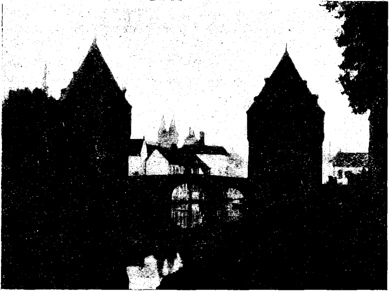
Pont du Broel (1913).

vaux Publics le 16 février 1895 et qui comprenait des représentants des sinistrés, n'eut aucune peine à établir que tous les moyens dont disposaient les services avaient été mis en œuvre pour assurer le plus rapidement possible l'écoulement des eaux. Mais en même temps elle indiqua tout un programme de travaux