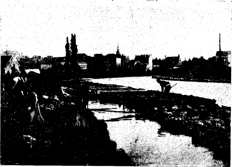
Rouissage du lin dans la Lys.

Gantois y trouvent de précieuses ressources pour la pêche et le canottage. Le bel artiste Emile Claus affectionnait tout spécialement cette vallée dont son pinceau a rendu la riante et claire beauté. Comme Emile Verhaeren, le chantre de l'Escaut, qui repose sur les rives du fleuve à Saint-Amand, Emile Claus, le