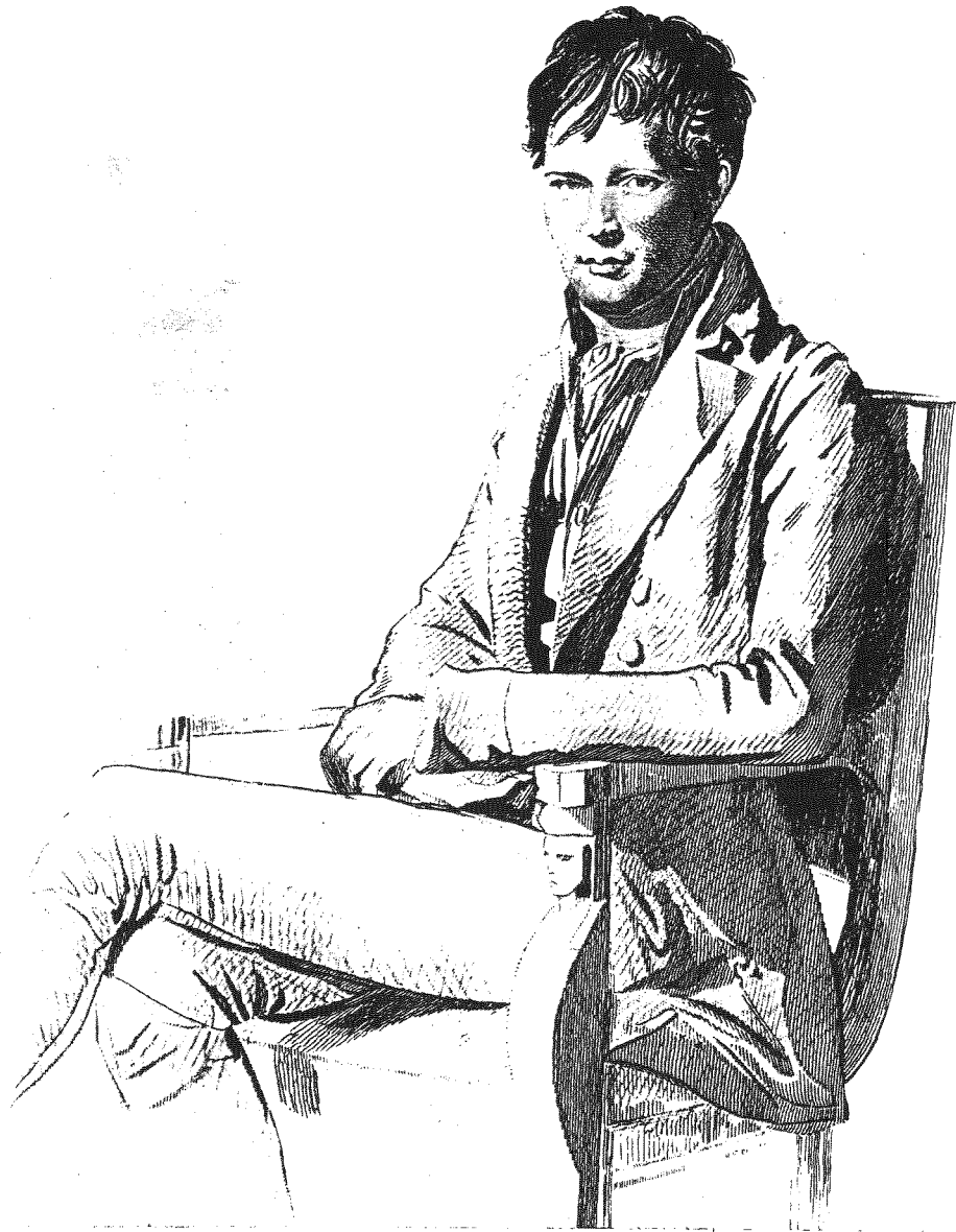
Abb. 1 Alexander von Humboldt (1769 – 1859) zur Zeit seines Helgoland-Besuchs (Bildnis von F.P. Gerard 1795)

interessanter war als heute. Die westliche Klippen waren noch durch die male- rischen Stacks (es gab seinerzeit mehrere, heute nur noch die „Lange Anna“) und Gatts (natürliche Felsbögen) sowie Slaps (felsige Einbuchtungen) ge- kennzeichnet. HUMBOLDT hat auch selbst noch den monumentalen (alten) Mönch gesehen, bevor dieser durch Ansturm der Wellen im Jahre 1939 zu- sammenstürzte, ebenfalls den großartigen Felsbogen von Möhrmersgatt. Die- ser stürzte im Jahre 1865 ein. Schon 30 Jahre nach HUMBOLDTs Besuch begann zaghaft der Fremdenverkehr auf Helgoland im Rahmen der Bemühun- gen, Stationen für die Meeresheilkunde zu gewinnen. In einem recht amüsant- en Bericht über eine Vergnügungstour von Hamburg nach Helgoland von Carl REINHARDT aus der Zeit um 1850 werden die physischen und natürlichen Schönheiten der Insel und die seltsamen Verhaltensweisen der Einheimischen sowie der Touristen kurz nach Eröffnung des ersten Hotels durch SIEMSEN im Jahre 1826 geschildert. Diese Quelle schließt einen recht aufschlußreichen Teil über die Popularisierung der Naturgeschichte der Insel mit einer allgemein- verständlichen Beschreibung der Muscheln, Algen, Fische und Fossilien aus den Kalkfelsen der Düne ein. Wie schon oben erwähnt, fand besonders die Meeresbiologie in der Öffentlichkeit ein breites Interesse.