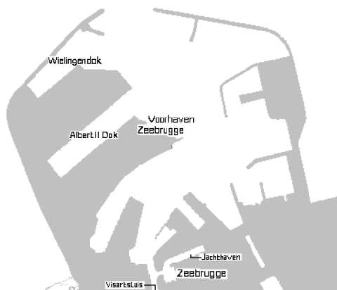
Kaart : Voorhaven Zeebrugge

aanduiding van resp. Tijdok en Prins Albert dok gebruikt) (Bilé & Trips 1970). Deze dokken zijn een oostelijke aftakking, zo'n tweehonderdvijftig meter noordwaarts van de Visartsluis, van de oude vaargeul en dus ook onderhevig aan de getijden (zie kaartje).